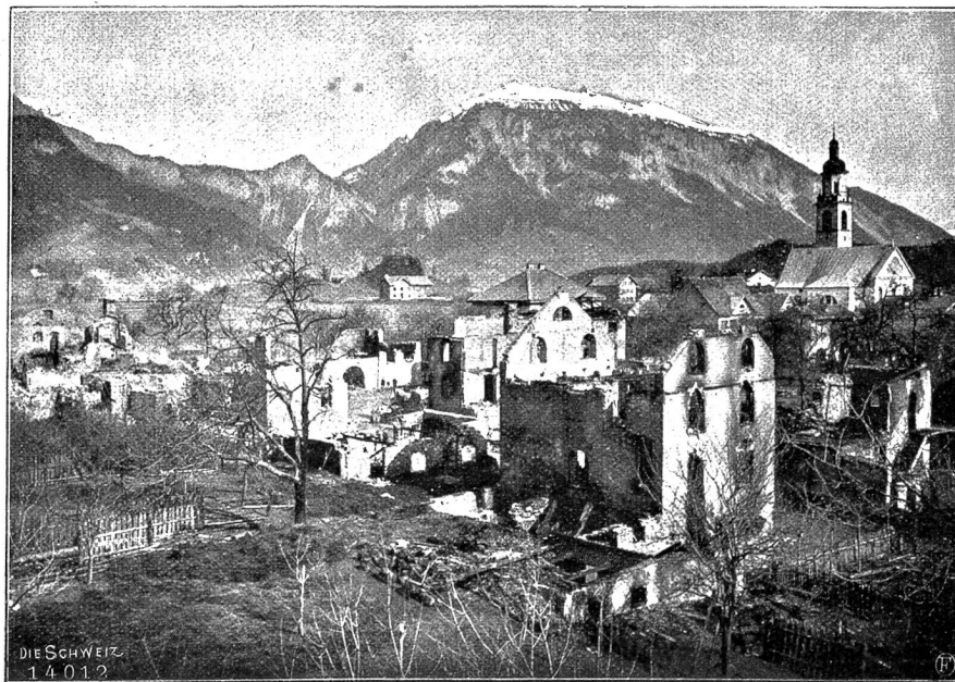
Rhäzüns im Domleschg. Brandstätte.