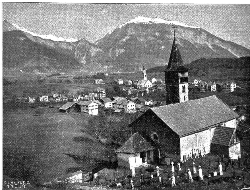
Rhäzüns im Domleschg. Im Vordergrund die alte St. Georgenkapelle mit Fresken a. d. 14. Jahrhundert.

falls das ganze Dorf verloren gewesen. Der junge Tag fand das Zerstörungswerk bereits vollendet, und die aufgehende Sonne beleuchtete eine traurige Szene. Der ganze oberhalb der Kirche gelegene Teil des Dorfes bildete nurmehr einen rauchenden Trümmerhaufen, aus dem bloß noch einige Mauern aufragten; Männer, Frauen und Kinder umstanden jammernd und wehklagend das Grab ihrer Habe. Es sind dreiundzwanzig Familien mit über hundert Angehörigen obdachlos geworden, und die wenigsten haben auch nur das Notwendigste zur Bekleidung des eigenen Körpers gerettet. Hier wäre Hilfe dringend nötig; denn der durch die Versicherung ungedeckte Schaden betrifft gerade die Ärmsten. Leider hat das Unglück auch zwei junge Menschenleben gefordert. Zwei Kinder im Alter von \frac{1}{2} und zwei Jahren sind im Feuer geblieben, während die Eltern aus dem zweiten Stockwerk ins Freie sprangen und schwer verletzt vom Platz getragen werden mußten. — Leider scheint es, daß auch diesmal die Frevlerhand, die das Unglück verschuldete, unentdeckt bleiben soll, die angehobene Untersuchung ergab bisher kein Resultat.