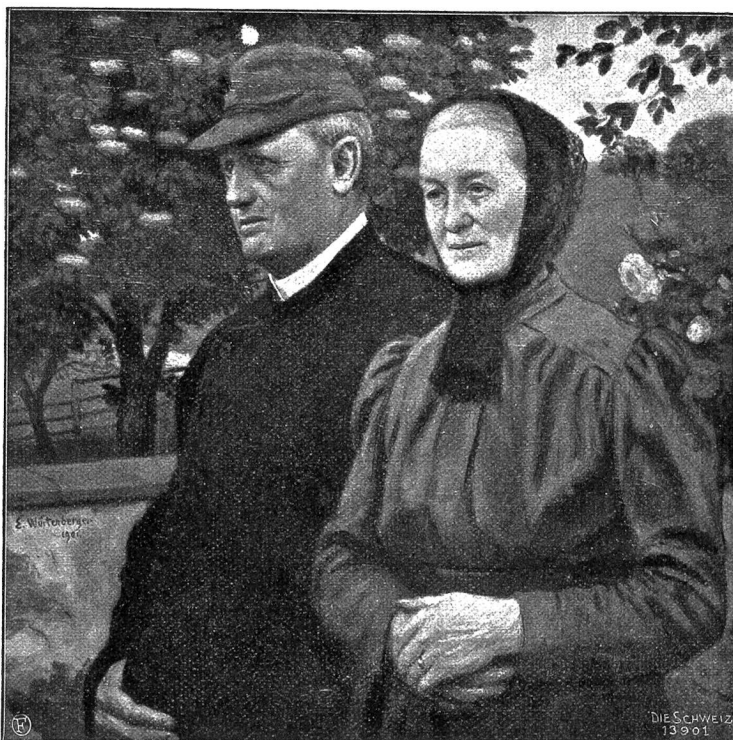
Doppelbildnis. Nach dem Gemälde von Ernst Würtenberger (Phot. Ph. & C. Zink, Zürich).

„Gälst du mich für eine Gans, Georg?“ fragt darauf die Dame mit beleidigter Würde, während sie sich zu ihrer vollen Höhe aufrichtet. „Geraldine natürlich wünschte es sehr; aber ich sagte ihr: Du kannst für dich selbst so unliebame Gesellschaft wie möglich auswählen; aber Papa und mich kannst du nicht dazu hinunterziehen. Ich bedaure genug, daß ich dir zu Gefallen bei diesen Leuten Besuch gemacht habe; ich bin