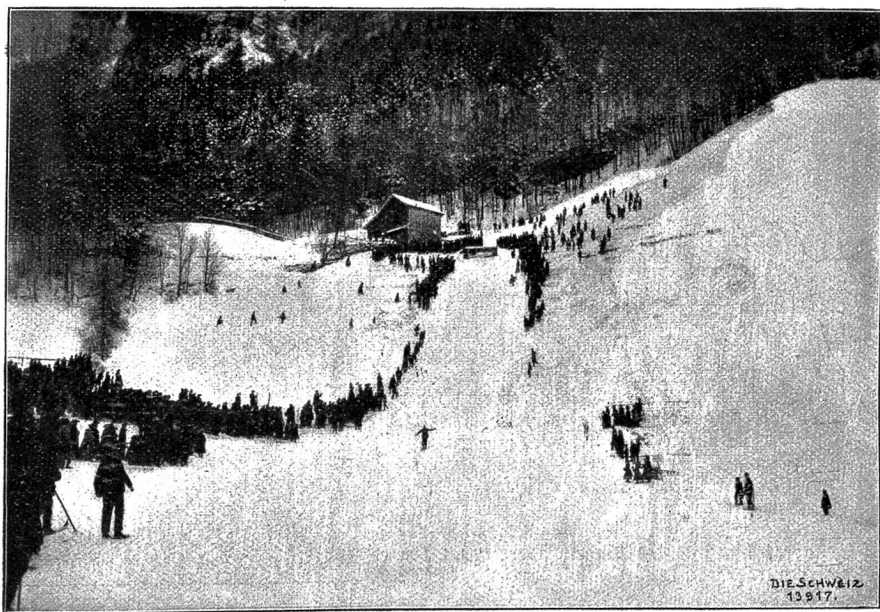
Die Glarner Ski-Sprungbahn nach norwegischem Muster. (Geherdahl nach glücklichem Sprung abfahrend).

Die größte Anziehungskraft auf die Zuschauer übte das norwegische Sprungrennen aus, für das an der steilen Berglehne des Glärnisch eine besondere Bahn hergerichtet war. Ihre Anlage geschieht folgendermaßen: nach einer etwa dreißig Meter langen, sehr stark geneigten Anlaufstrecke wird ein kurzes Stück beträchtlich aufgeschüttet und nach vorne zwei bis drei Meter tief senkrecht abgegraben, sodaß eine hohe Stufe entsteht, die wie ein Sprungbrett wirkt. Jeder Gegenstand, der die Bahn