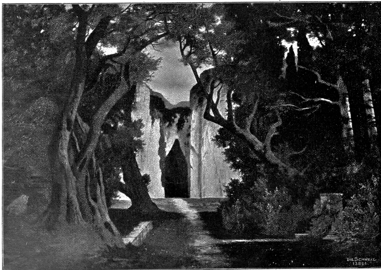
Eingang zur Unterwelt (aus der Oedipusfage). Nach dem Gemälde von Eduard Rüdisühli, Basel.

„Sie tun am besten, Sie gehen fort und lassen