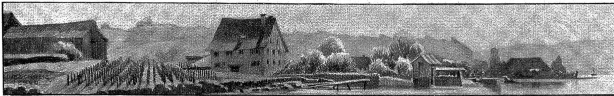
Am Zürichsee bei Rüschach.