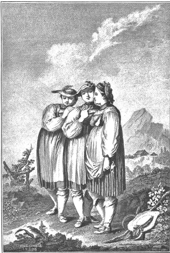
Die drei Grazien vom Guggisberg. Nach einem ältern Stich.

Der ungenügende Bodenertrag und die Vermehrung der