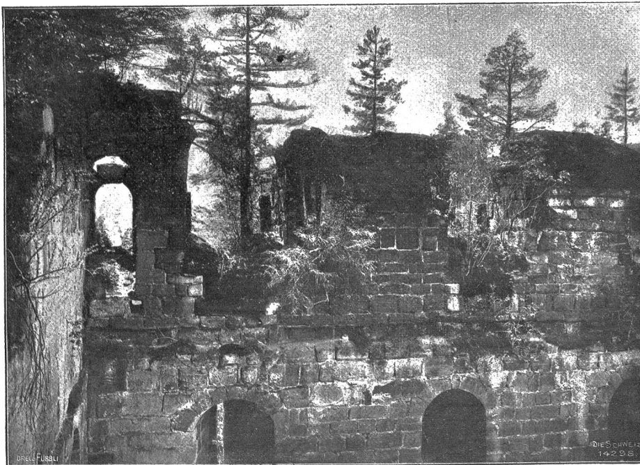
Ruine Grasburg, St. Bern (Phot. J. Mohr, Bern).

Ganz bemerkenswert, ja hervorragend in landschaftlicher und historischer Beziehung ist die Grasburg, wohl die größte Ruine und großartigste Schloßanlage des Kantons Bern, auf hohem, senkrecht zur tief eingeschnittenen Sense abstürzendem Sandsteinfelsen thronend. Von ihr aus wurde bis 1575 das Land zwischen Sense und Schwarzwasser bis an den Berggrat der Neuenenfluh und Mährenfluh (in der Stockhornkette) regiert. Ursprünglich wohl burgundisches Krongut, dann unter den Zähringern Reichsburg und Grenzfestung gegen Westen, kam sie im Jahr 1310 als Pfandschaft an das Haus Savoyen. In diesem Jahrhundert erscheinen auch urkundlich ein Landamann und die Landleute von