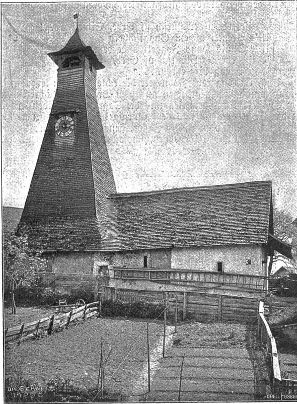
Alte Kapelle in Schwarzenburg, St. Bern (Phot. F. Mohr, Bern).

eingeborenen Bevölkerung zwang viele teils zur endgültigen Auswanderung, teils (und das noch heute) zum Handel und Hausieren mit den in den langen Wintern verfertigten Gabeln, Rechen, Körben usw. in den benachbarten Landesgegenden, wobei Weib und Kind den tuchüberspannten zweirädrigen Karren zu begleiten pflegen. Dieses Wanderleben in der schönen Jahreszeit nahm aber mancher Familie die Lust zur ersten Bearbeitung des heimischen Bodens und führte leicht zum bloßen Vagieren und gar zum Bettel. Diese Leute wurden denn in den Teurungszeiten von 1817 und 1845 zur wahren Landplage ihrer Nachbarn. In neuerer Zeit aber schwingt sich die Bevölkerung dank den verbesserten Verkehrswegen, die bald durch eine Eisenbahn ersetzt sein werden, durch intensiv betriebene Milchwirtschaft und Viehzucht zu wesentlich bessern Verhältnissen auf, und es ist jetzt eine wahre Freude, durch diese Gebirgslandschaft mit ihren gut bearbeiteten Heimweiden zu wandern. Freilich bleibt in abgelegenen Weilern noch manches zu wünschen übrig.