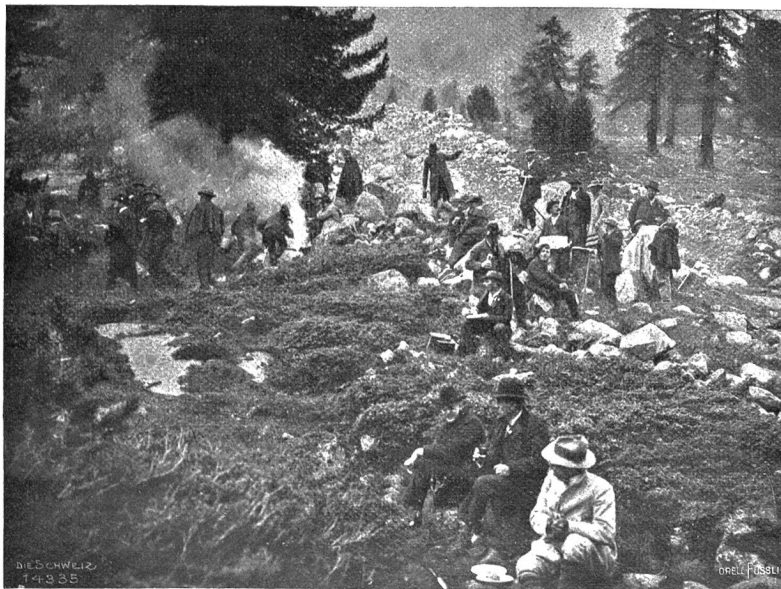
Vom Zentralfest des S. H. C. (12.—14. Sept. 1903): Picknick auf der Ghimetta bei Pontresina.

à fournir des vivres aux blessés jusqu'au moment de l'évacuation.