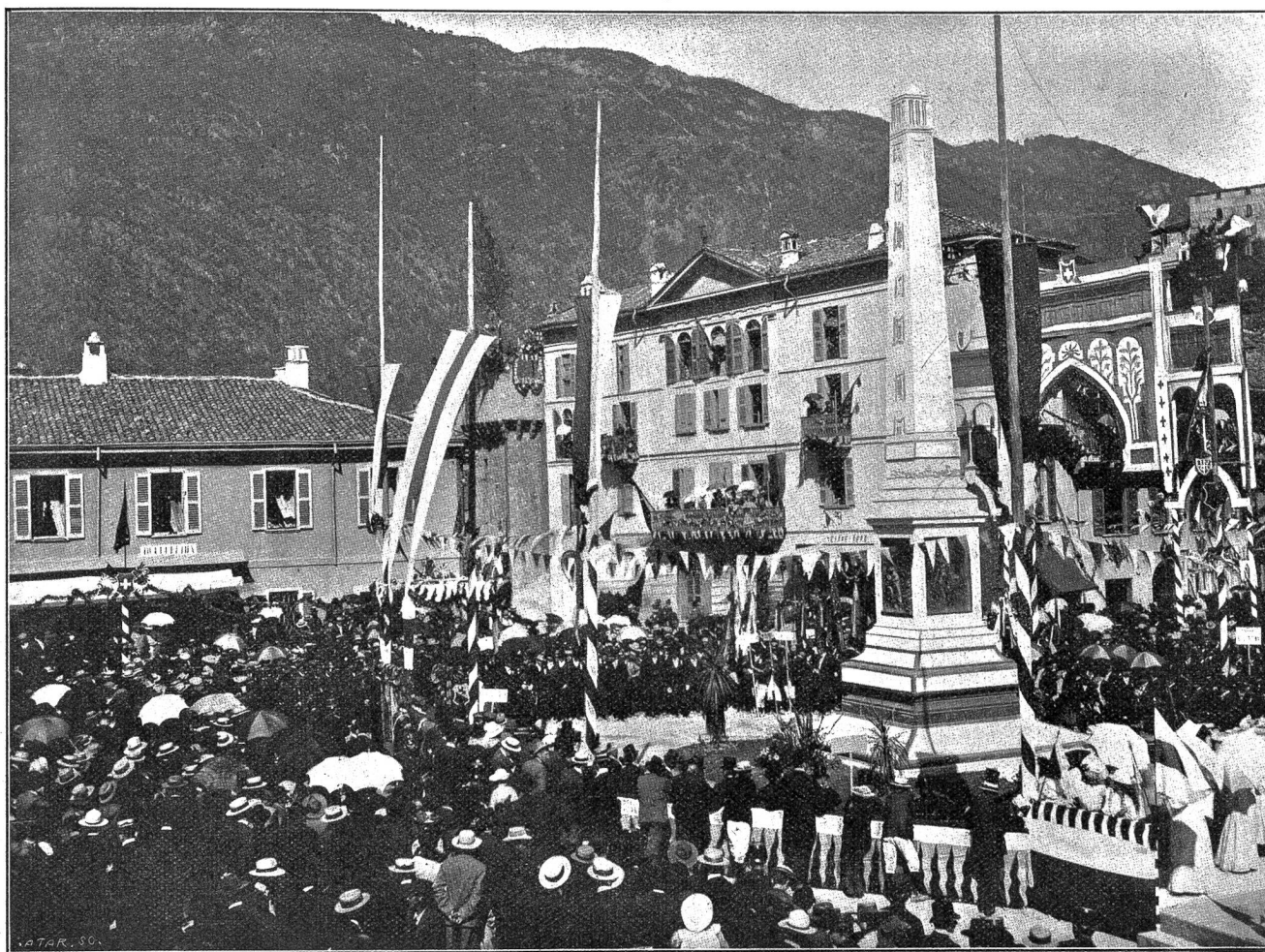
Von der Tessiner Jahrhundertfeier in Bellinzona: Einweihung des Freiheitsdenkmals auf dem St. Rochusplatz am 10. Sept. 1903.

Vertreter der eidgenössischen und kantonalen Behörden und eine vieltausendköpfige Menge wohnten der erhebenden Feier bei. — Daran schloß sich ein hübsch arrangierter Umzug. Zwei der schönsten Gruppen führen wir unsern Lesern vor. Besonders die eine, die „Blumenkönigin“ verriet in ihrem Arrangement einen so feinen Geschmack und eine solche Virtuosität in der Verwendung von Blumen als Dekoration, daß dieser Wagen dem elegantesten Blumenkorso Nizzas alle Ehre gemacht hätte.