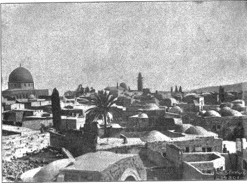
Blick auf Jerusalem, links die Kuppel des Felsendoms auf dem Tempelplatz.

schädig kehrte man ihm den Rücken und zuckte die Achseln über den Juden, den man eben verlacht und verspottet und der nur Freundlichkeit dagegen hatte. Dafür hatten sie kein Verständnis. Freilich war sich Lipmann selbst nicht klar bewußt, ob er aus Charaktergröße so handelte oder aus Charakterschwäche, auf alle Fälle hatte er einen Sinn, der leicht verzieh, so zäh und ausdauernd er sonst sein mochte.