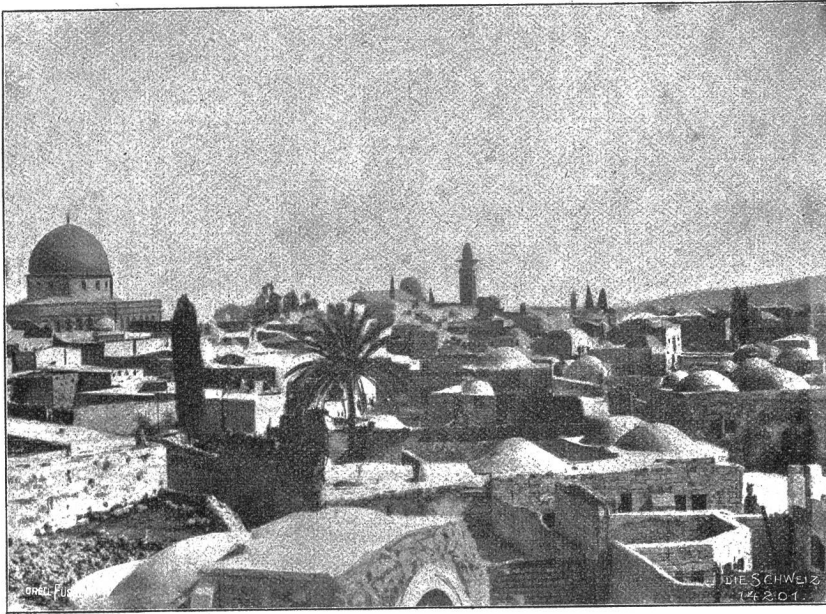
Blick auf Jerusalem, links die Kuppel des Felsendoms auf dem Tempelplatz.