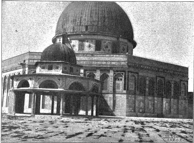
Kubbet es-Sachra, der Felsendom auf dem Tempelplatz von Jerusalem.

Zwei Tage später lief das Schiff in Neu-York ein. Sämtliche Zwischendeckpassagiere waren entlassen und standen und saßen im Dock, um ihre Habseligkeiten von der Zollbehörde untersuchen zu lassen. Einige mit ängstlicher Miene ob des Ungewohnten, das ihnen bevorstand, andere gleichgültig, wieder andere pfiffig blinzeln im Gedanken an wohlverwahrte, meist wertlose Kleinigkeiten. Alle hatten ihre Kisten und Säcke geöffnet und warteten, bis die Reihe des Untersuchens an sie kam. Nur unser Lipmann durfte unbeanstandet das Dock verlassen, er hatte keinerlei Bestiztum. Sein Säcklein hing in so beredter Weise über seinem Rücken, daß es gar keiner Worte bedurfte. Dennoch zweifelte kein einziger der Mitpassagiere daran, daß der Israelite wirklich sein Glück machen werde, und zuversichtlich ging er selber seiner neuen Heimat entgegen. In seiner Tasche trug er einen Empfehlungsbrief an einen angesehenen Glaubensgenossen in Neu-York. Der würde ihm eine Stelle verschaffen, sein Crispartes würde ihm weiterhelfen und die guten, goldenen Tage würden kommen, einer nach dem andern. Ein eigen Gefühl kam über ihn, ein Gefühl erwartungsvoller Andacht. „Es wird schon gehen,“ nickte er.