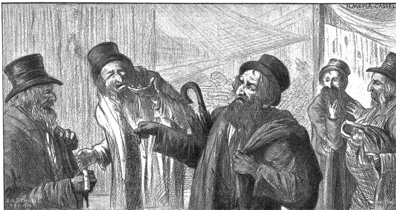
Polnische Juden auf der Leipziger Messe. Kopfleiste von Hans Meyer-Cassel.