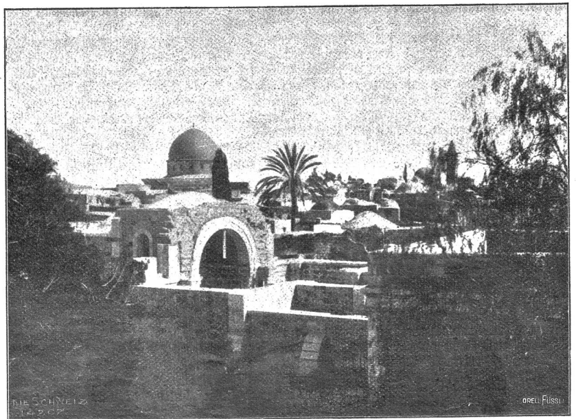
Blick auf den Felsendom von Jerusalem.

Zuerst war sein Weinen ein Weinen um Großes, um die seinem Gott angetane Schmach; dann weinte er über die Mißachtung und Kränkung, die dem Juden widerfahren, und zuletzt verwandelten sich seine hohen Gefühle in Wehmut über die unförscher gewordenen Mägen, weshalb seine letzten Tränen seinem hungrigen Magen und seiner verdorbenen Nahrung galten. Und auf dieser Stufe angekommen, erwachte auch der Jude in ihm, der vor allem an seinen Vorteil denkt. Eilig stürzte er fort, um den Kapitän zu suchen und ihm unter Wehklagen und Jammern die ihm widerfahrne Unbill vorzutragen. In grellen Farben wußte er zu schildern, seine Arme hoben sich, und seine Augen funkelten, der ganze Mensch war eine Illustration zu dem, was er erzählte, aber mehr die