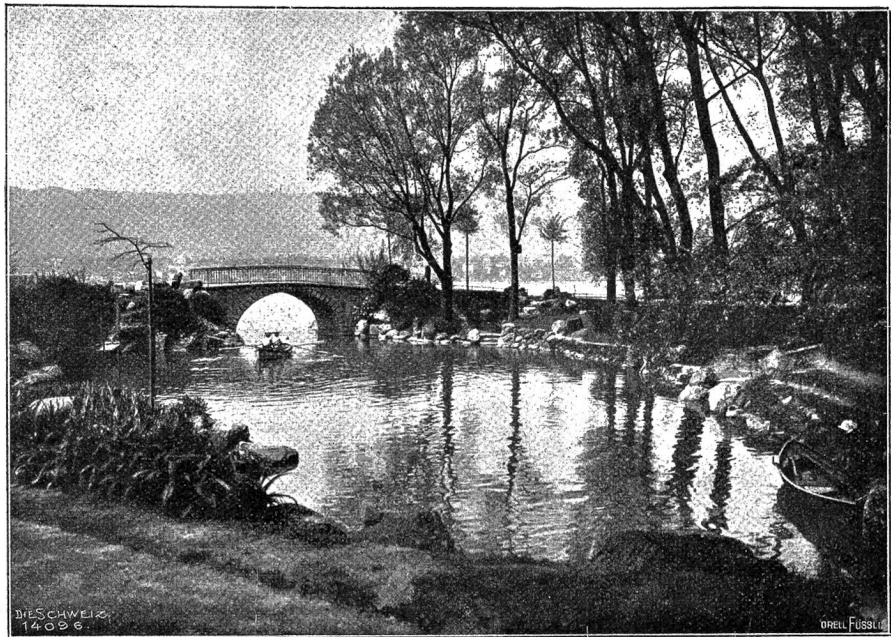
Beim Zürichhorn (Phot. A. Krenn, Zürich).

Bald nahm diese Pracht ein Ende, um neuen Schönheiten Raum zu geben. Die Berge wurden niedriger und rückten in die Ferne. Immer weitere Perspektiven öffneten sich; saattrüne Wiesen dehnten sich in üppigen Tälern aus; an Stelle felsiger Gebirgsrücken traten hügelige, bebaute Höhen mit friedlichen Weilern und weißen kleinen Kirchen. Und nun breitete sich das Becken eines großen und breiten Sees aus, dessen jenseitige Ufer in leichten blauen Nebeln verschwammen. Große, zum Teil städtisch gebaute Dörfer streifte der Zug auf seinem Flug, bis er bei einer malerisch am See gelegenen kleinen Stadt sein Tempo verlangsamte und am Bahnhof anhielt. Es war das