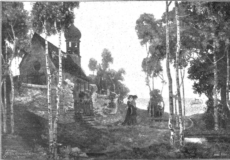
Abendfrieden. Nach dem Gemälde von Alfred Mager, Mischikon bei Zürich.

Nachdem er sich gefaßt, begab er sich zum Brunnen, der hinter dem Haus in einem kleinen Gärtchen stand und wusch sich dort mit kühlem Wasser Gesicht und Hände, während die frühlingstrunkenen Vögel rings um ihn fangen. Erfrischet kehrte er in die Wohnung zurück, wo er sein Frühstück be-