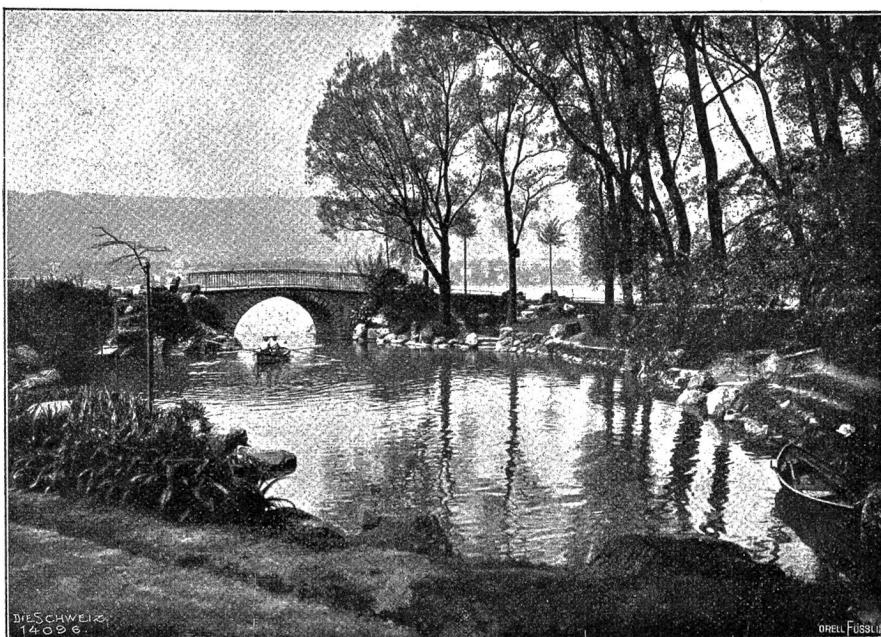
Beim Zürichhorn.

Bald nahm diese Pracht ein Ende, um neuen Schönheiten Raum zu geben. Die Berge wurden niedriger und rückten in die Ferne. Immer weitere Perspektiven öffneten sich; saattrüne Wiesen dehnten sich in üppigen Tälern aus; an Stelle felsiger Gebirgsrücken traten hügelige, bebaute Höhen mit friedlichen Weilern und weißen kleinen Kirchen. Und nun breitete sich das Becken eines großen und breiten Sees aus, dessen jenseitige Ufer in leichten blauen Nebeln verschwammen. Große, zum Teil städtisch gebaute Dörfer streifte der Zug auf seinem Flug, bis er bei einer malerisch am See gelegenen kleinen Stadt sein Tempo verlangsamte und am Bahnhof anhielt. Es war das