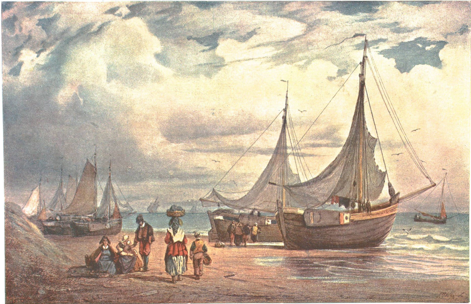
Strandbild (Bei Scheveningen an der Nordsee). Nach dem Aquarell von † Joh. Jakob Ulrich (1852). Original in der Kupferstichsammlung der Polytechnischen Schule.