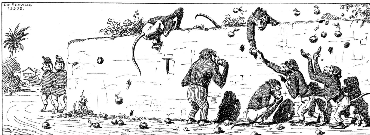
Hepfeldiebe I. Kopfseife von Evert van Nuyden.