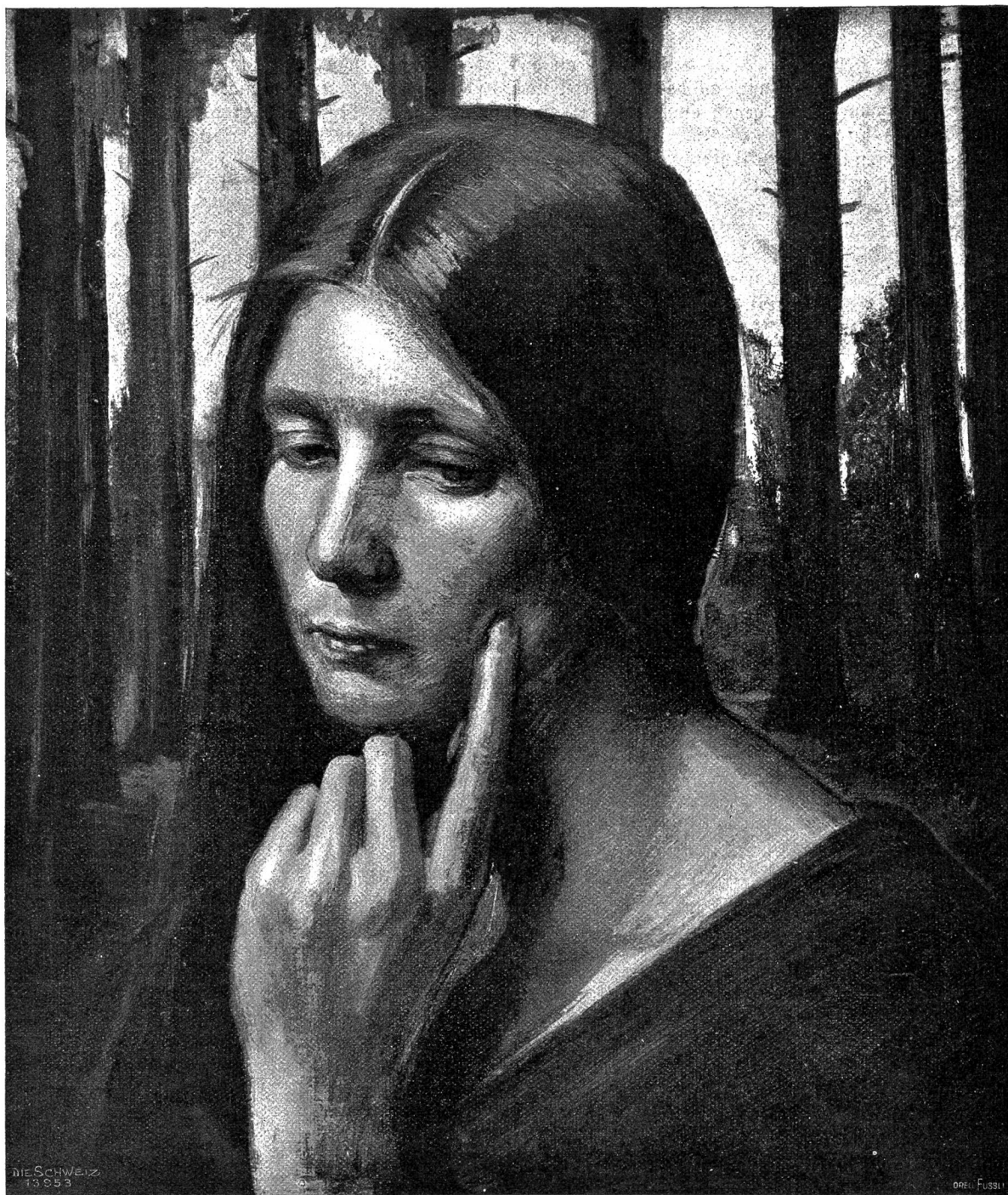
Melancholie. Nach dem Gemälde von Ottilie W. Moederstein, Zürich-Frankfurt a. M.

erinnerung widerstrahlten. Da war eine sonnengold- übergossene Sommerlandschaft mit anmutigen Putten, die sich auf prächtiger Wiese tummeln. Wieder ein anderer Vorwurf atmete hohe reine Hochgebirgsluft und gab mit dem klaren, tief ins Bild steigenden Himmel und den zauberhaften Fernwirkungen des Schneegebirgs eine hohe Stimmung erdbefreiter Seligkeit wieder. Ein wunderbar farbenklares Bild stellte eine stille Seebucht dar, in der sich ein ferner, schneegekrönter Berg herrlich spiegelt; ein Kahn liegt still im Schilf und scheint der