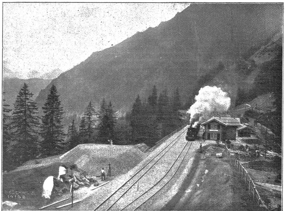
Albulabahn: Der erste Zug bei Bergün! (Phot. A. Krenn, Zürich).