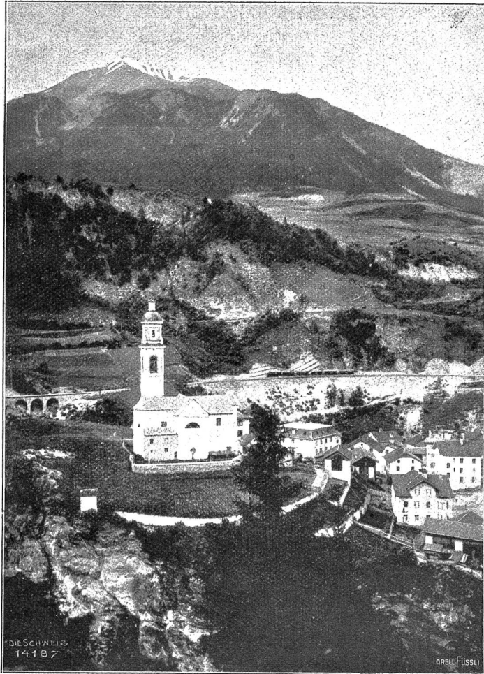
Albulabahn: Tiefenkastel, Ausgangspunkt der Julierstraße.