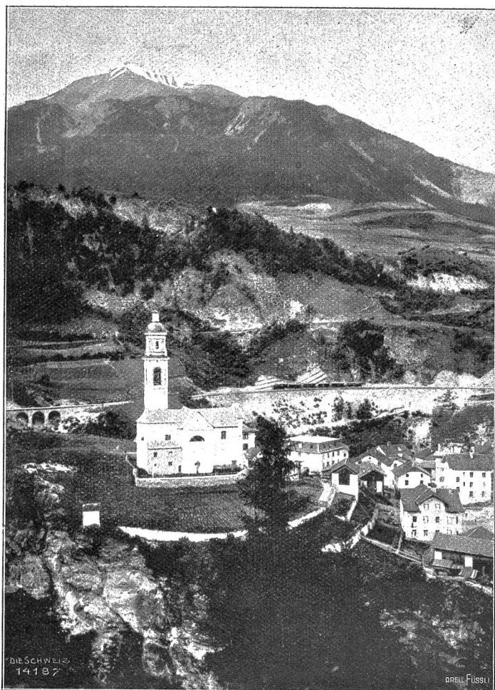
Albulabahn: Tiefenkaibel, Ausgangspunkt der Julierstraße. (Phot. A. Krenn, Zürich).