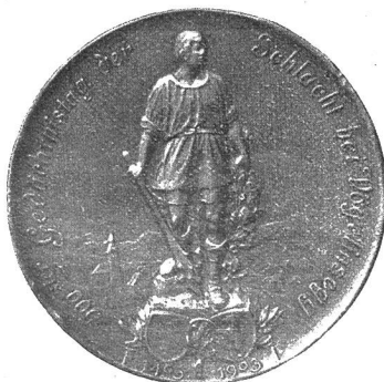
Appenzeller Denkmünze, entworfen von Kaufmann, Luzern.