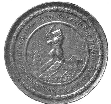
Rückseite der Appenzeller Denkmünze mit Wappen von Speicher.