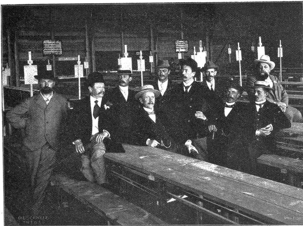
Bildhauer Otto Steiger.