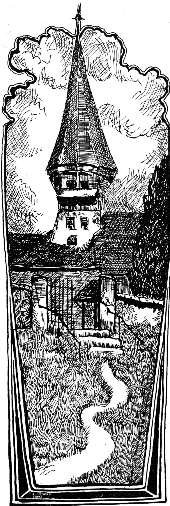
Kirchlein von Wytikon bei Zürich.

Alein nicht die Entbehrung solcher Liebenswürdigkeiten quälte ihn, sondern die Ungewißheit, ob dabei irgend eine versteckte Absicht oder aufdämmernde Ahnung