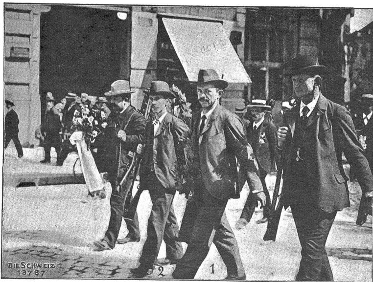
Heimkehr der siegreichen Schweizerschützen aus Rom