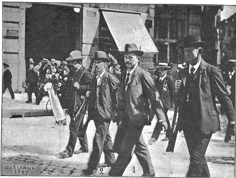
Heimkehr der siegreichen Schweizerschützen aus Rom

Leslie hielt Wort. Es wurde Edna Gelegenheit geboten, mit mehreren hervorragenden Geistesgrößen persönlich zu verkehren; mit andern trat sie in Korrespondenz. Als sie ihr einundzwanzigstes Jahr er-