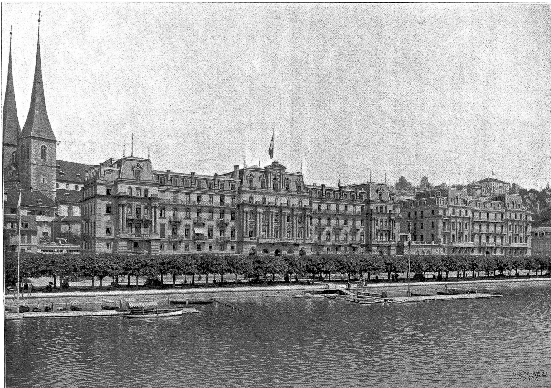
Quai National in Luzern.