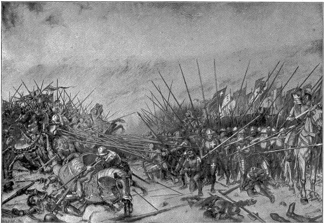
Internationales Kriegs- und Friedensmuseum, Luzern: Schlacht bei Grandson, Gemälde von R. Fauslin.

Vene merkte, daß das, was sie sich seit dem Frühling zusammengekommen hatte, ihr wie Wasser aus der Hand glitt, und jedesmal, wenn ihre Befürchtungen wieder neue Nahrung erhielten, zuckte es ihr in den Armen, das flüchtige Glück zu fassen und mit aller Kraft zu halten. Manchmal aber stieg ein sträflicher Gedanke in ihr auf: „Möchte er doch sterben, er oder ich! Dürfte ich ihn doch umbringen, ihn oder mich!“