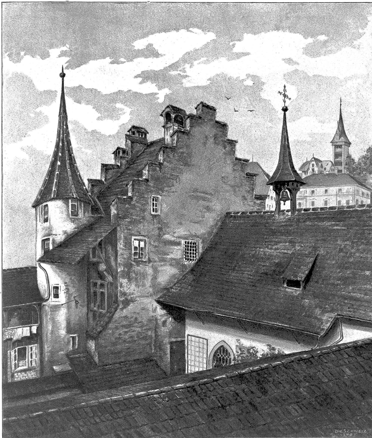
Ein Stück Alt-Luzern. (Nach Aquarell von Oskar Limacher).

Laurentianische Kapelle mit einem Teil des Schöbinger'schen Hauses neben der „Muntiatür“ am Löwengraben (von einem Atelier der Kunstgewerbeschule aus aufgenommen).