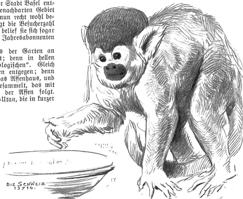
Totenkopffäffchen ( Chrysotrux sciurea ).