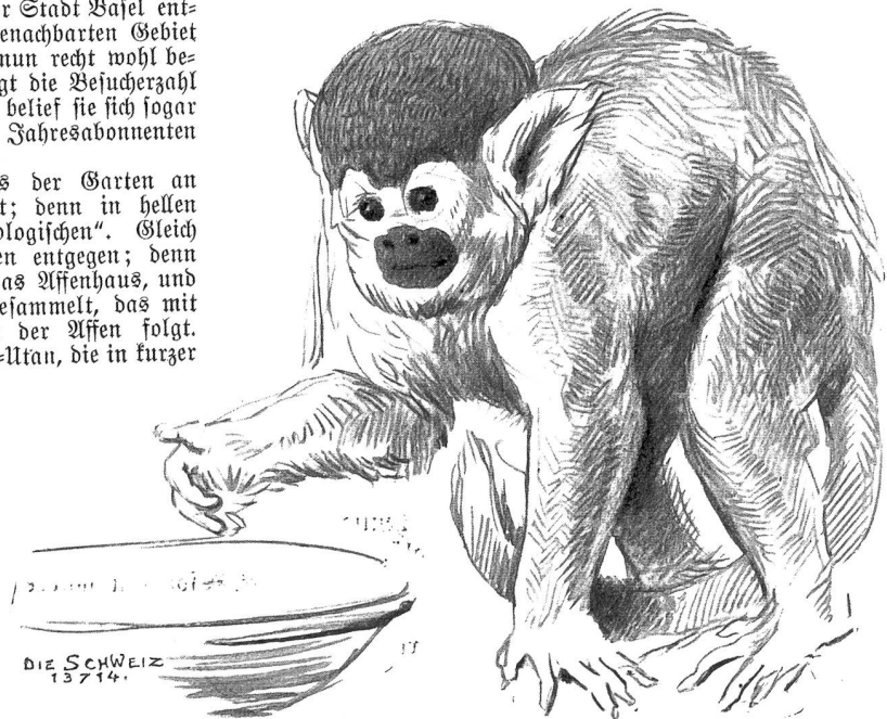
Totentopffäffchen ( Chrysotrrix sciurea ).