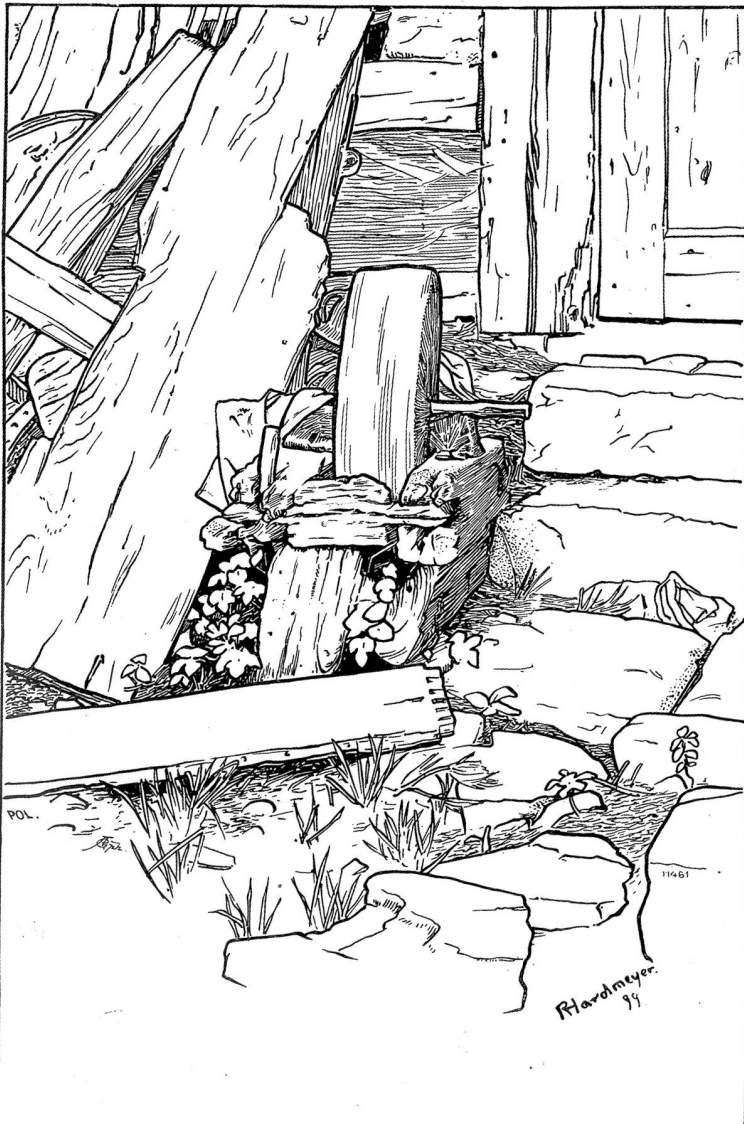
„Schleiffstein“, Studie aus dem Wehthal von Robert Hardmeyer, Küssnach.