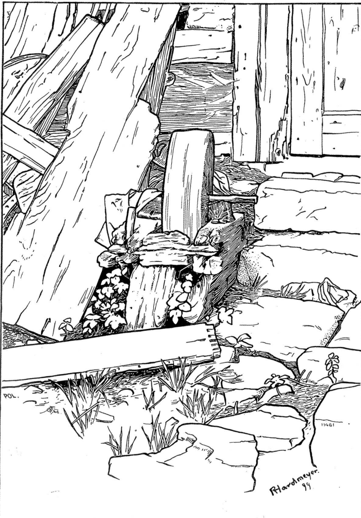
„Schleifstein“, Studie aus dem Wehthal von Robert Hardmeyer, Rüssach.