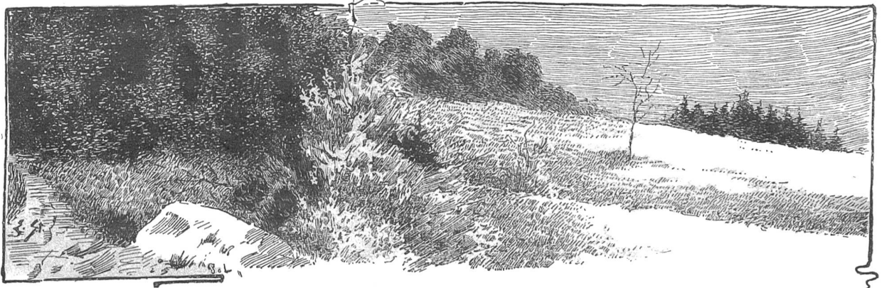
Landschaft, Federzeichnung von Eduard Stiefel.