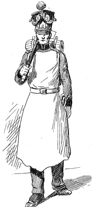
Zürich 1819. Sappeur der Grenadiere (Hellblau).

schleuderte sie seine Rechte, als wäre sie ein giftiges Reptil, von sich und rief mit erhobener Stimme: „Geh, ich mag von dir nichts hören; du hast auch gelacht und bist nicht besser wie die andern.“ Dabei funkelten ihn ihre grünlichleuchtenden Augen an wie die einer Kage. Der junge Mann war sprachlos. War das seine Angela, seine sonst so hingebende Braut, die sich ihm bisher allzeit fast willenlos untergeordnet hatte? Konnte das wirklich nur Verstellung gewesen sein, o, und er mußte dies nach ihrem heutigen Gebahren und nach Freds Worten ja glauben — dann freilich war es aus mit dem süßen Frieden im stillen Pfarrhaus, in das er sie in wenigen Wochen als sein geliebtes Weib führen wollte — dann graute ihm vor der Zukunft an ihrer Seite. Feldern gedachte seines Verlobungsabends; schon damals hätten ihm bei Pauls und Freds Neben die Augen aufgehen müssen, wäre er nicht so völlig von Angelas Schönheit geblendet gewesen.