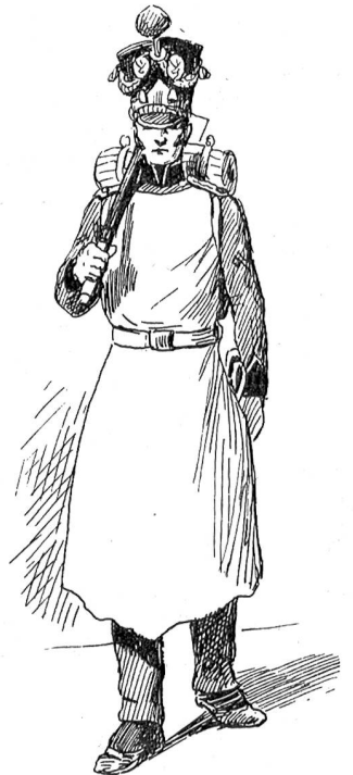
Zürich 1819. Sappeur der Grenadiere (Hellblau).

schleuderte sie seine Rechte, als wäre sie ein giftiges Reptil, von sich und rief mit erhobener Stimme: „Geh, ich mag von dir nichts hören; du hast auch gelacht und bist nicht besser wie die andern.“ Dabei funkelten ihn ihre grünlichleuchtenden Augen an wie die einer Kage. Der junge Mann war sprachlos. War das seine Angela, seine sonst so hingebende Braut, die sich ihm bisher allzeit fast willenlos untergeordnet hatte? Konnte das wirklich nur Verstellung gewesen sein, o, und er mußte dies nach ihrem heutigen Gebahren und nach Freds Worten ja glauben — dann freilich war es aus mit dem süßen Frieden im stillen Pfarrhaus, in das er sie in wenigen Wochen als sein geliebtes Weib führen wollte — dann graute ihm vor der Zukunft an ihrer Seite. Feldern gedachte seines Verlobungsabends; schon damals hätten ihm bei Pauls und Freds Neben die Augen aufgehen müssen, wäre er nicht so völlig von Angelas Schönheit geblendet gewesen.