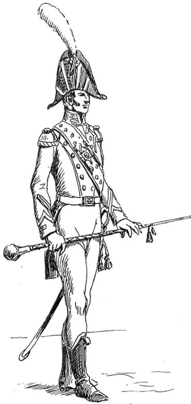
Zürich 1819. Tambourmajor. (Rock dunkelblau, Hose hellblau).

Gerlinde entwand sich hastig seiner Umarmung; unwillkürlich suchte ihr Auge Feldern, der aber in Gedanken versunken, mit zur Erde gesenkten Blicken neben seiner Braut dahinschritt.