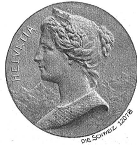
Schweizerdorf-Medaille Paris 1900, von G. Santz.

vates abhängen, der seinen Sitz eines Tages von der Schweiz nach Frankfurt oder Budapest verlegen könne, statt dem Fleiß, der Tüchtigkeit und der gesunden Vernunft des gesamten Volkes des Landes Wohl zu verdanken.