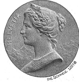
Schweizerdorf-Medaille Paris 1900, von G. Santy.

rates abhängen, der seinen Sitz eines Tages von der Schweiz nach Frankfurt oder Budapest verlegen könne, statt dem Fleiß, der Tüchtigkeit und der gesunden Vernunft des gesamten Volkes des Landes Wohl zu verdanken.