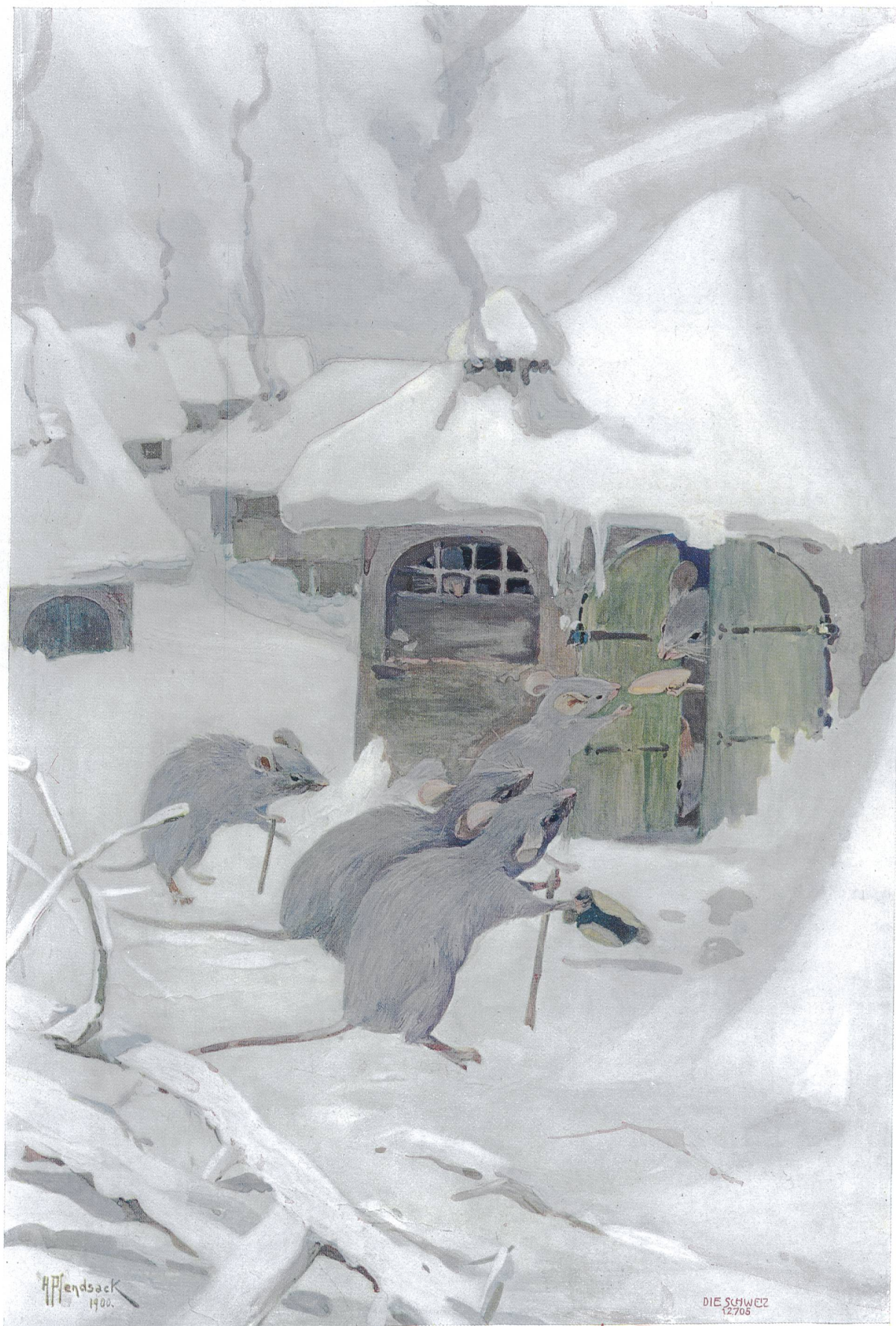
Eine mitleidige Seele. Aquarell von Hugo Pfendsack, (Printreit) Paris.