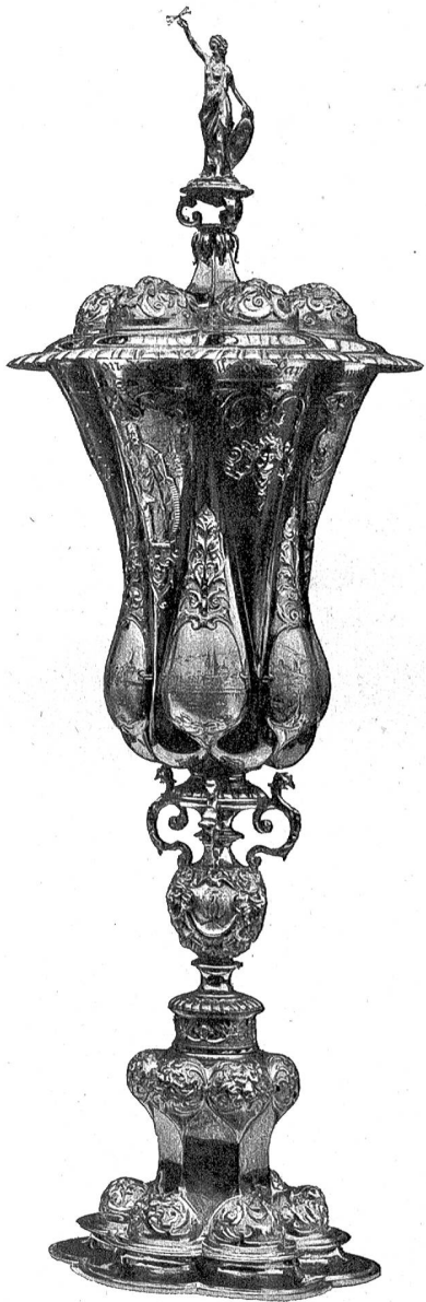
Becher von Bohard, Luzern.

Aber Katherine vergaß ihn nicht. Das Andenken dieser Stunde begleitete sie vom Morgen bis zum Abend und die ganze Nacht hindurch. Sie konnte die Gedanken nicht mehr davon losreißen; sie kämpfte und litt, und sie konnte nicht. Die Erinnerung marterte sie in ihrem Stolz; denn sie fühlte klar und deutlich,