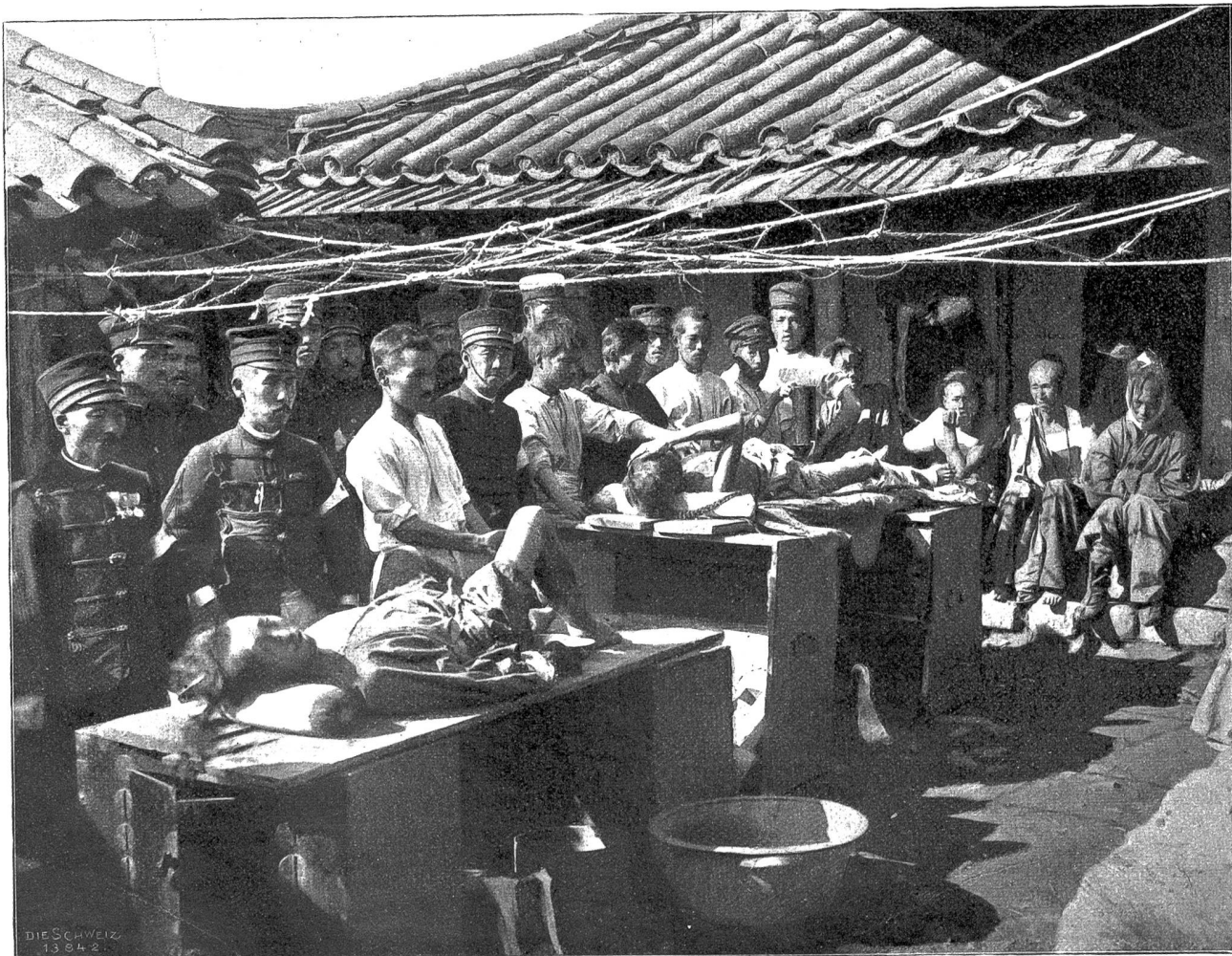
Japanische Armeearzte operieren chinesische Gefangene.

Man vergißt, daß er oft ganz besonders düster und traurig auf seinen schwerfälligen kleinen Jungen blickt und etwas sagt, was der Junge nicht ganz ordentlich versteht, Worte, deren Sinn er nur zuweilen erhascht: „Bist der Begabtesten einer,