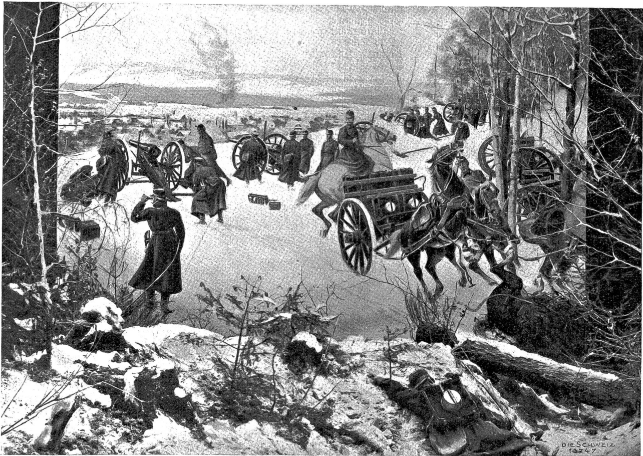
Batteriefeuer mit rauchlosem Pulver, Diorama von Jos. Clemens Kaufmann im Internationalen Kriegs- und Friedensmuseum zu Luzern. (Phot. Emil Gock, Luzern).