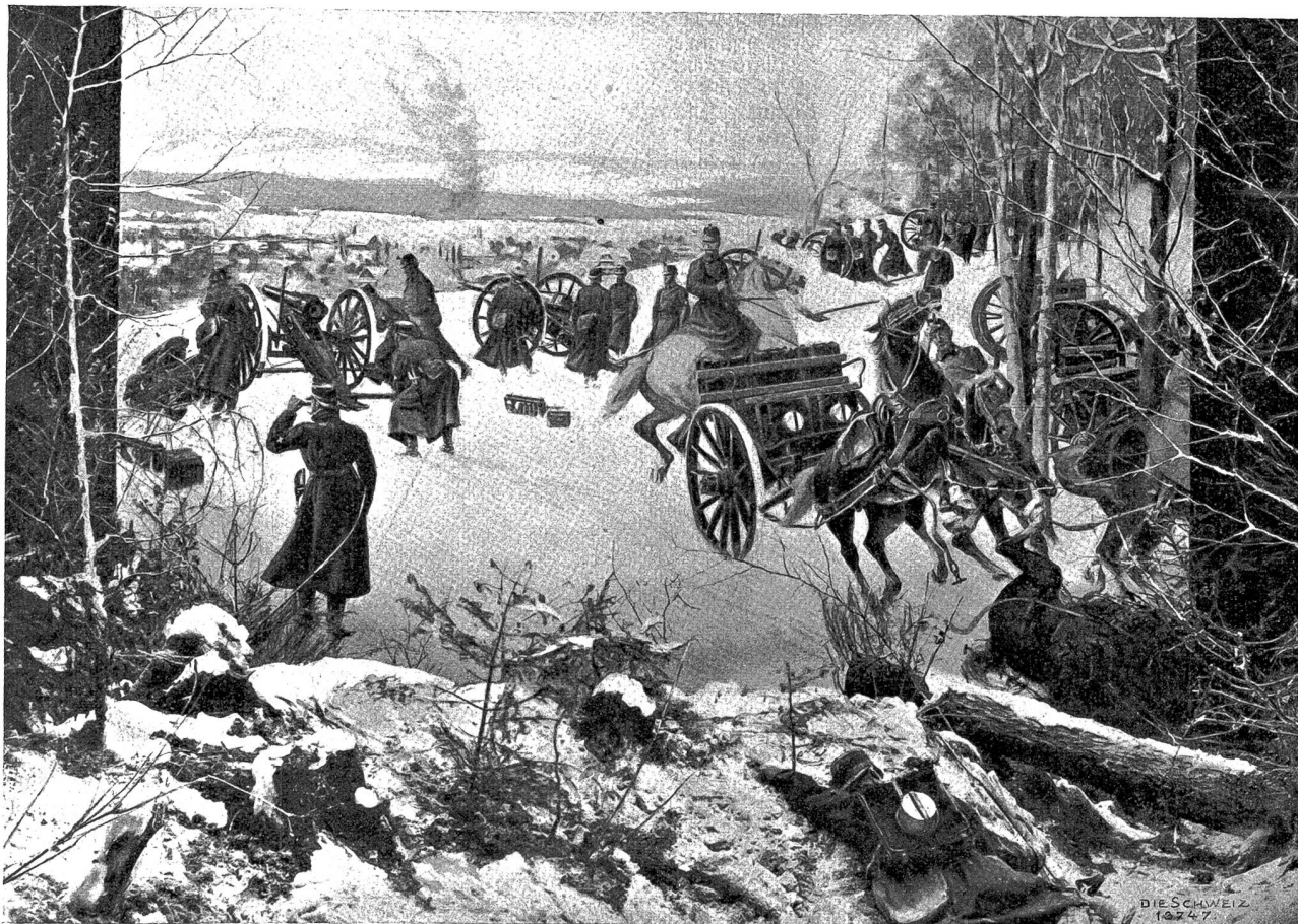
Batteriefire mit rauchlosem Pulver, Diorama von Jos. Clemens Kaufmann im Internationalen Kriegs- und Friedensmuseum zu Luzern.