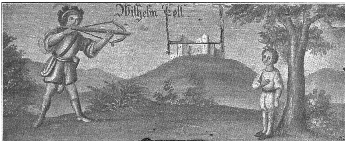
Tells Apfelschuss. Delmalerei auf einem Bienenkasten, etwa 1/2 natürlicher Grösse.