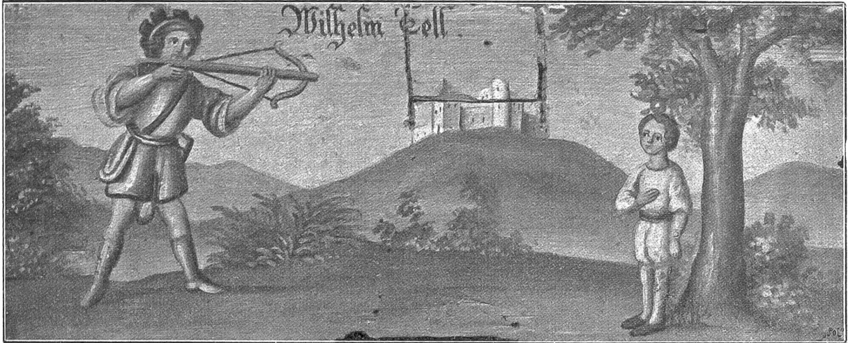
Tells Apfelschuss. Delmalerei auf einem Bienenkasten, etwa 1/2 natürlicher Größe.