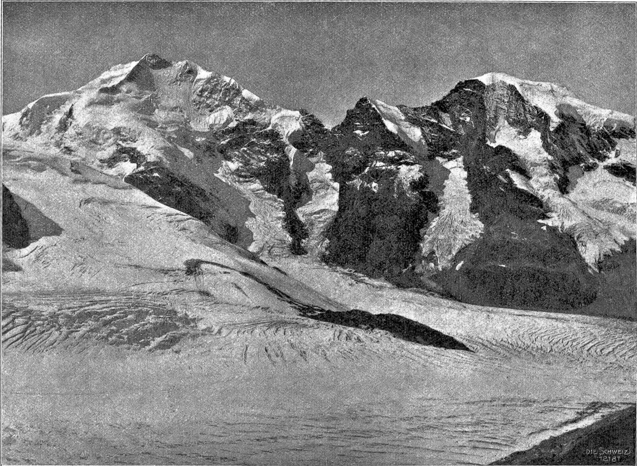
Piz Bernina und Piz Morteratsch von der Diavolezza aus nach Westen gesehen; im Vordergrund der Morteratschgletscher.

im Vordergrund ganz schneefrei, und die Spalten treten auf's deutlichste hervor. Beim Vadret da Pers (Abb. 1), soweit er hier sichtbar ist, herrschen die Querspaltan vor, die quer durch den Gletscher, senkrecht zu seiner Längsachse, entstehen. Die Ursache dafür ist meistens eine Unregelmäßigkeit des Gefälls. Wenn nämlich die Eismassen in ihrer langsamen, halb gleitenden, halb fließenden Bewegung über eine steilere Böschung herunterkommen, so werfen sich solche Querspaltan auf. Weiter unten, auf flacherem Boden schließen sich die Spaltan wieder. — Der Morteratschgletscher (Abb. 2) zeigt ganz im Vordergrund eine andere gesetzmäßige Spaltanbildung, da gehen die Spaltan vom Rande des Gletschers schief aufwärts, es sind sogenannte Längsspaltan. — Der hintere Gletscherarm, der vom Fuß des Piz Bernina herkommt, zeigt auf dem ebenen spaltanfreien Teile noch eine dritte Erscheinung. Wogenförmige Streifen, deren konvexe Seite thalabwärts gerichtet ist, gehen quer über den Gletscher. Es sind Schmutzstreifen, die ursprünglich gerade über den Gletscher gingen, aber in diese Wogenform ausgezogen wurden, weil das Eis in der Mitte sich schneller bewegte als am Rande, gerade wie auch das Wasser in der Mitte eines Flusses rascher fließt als am Ufer. Im untern Teil, gegen den Rand des Bildes hin verwischen sie sich; dafür treten da wieder Spaltan auf.