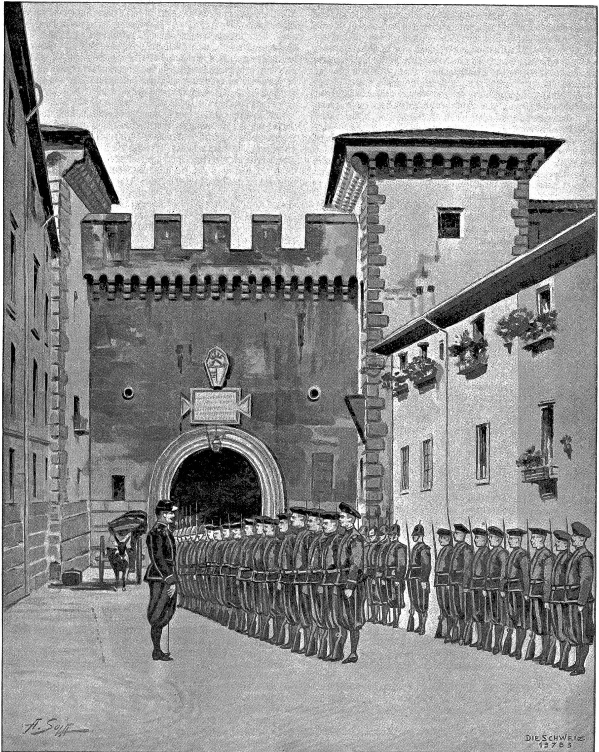
Im Kasernenhof des Vatikan. Sepiazeichnung von A. Soja in Küsnach bei Zürich.