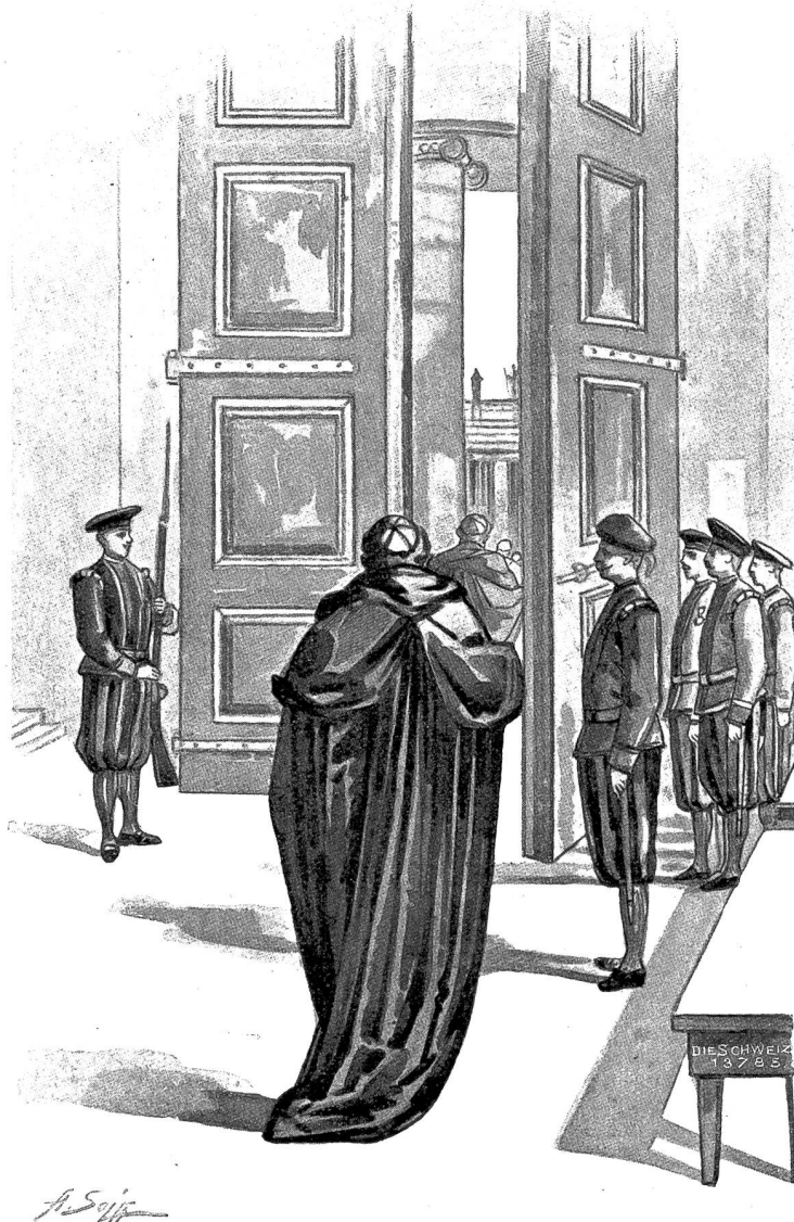
Schweizergardisten bei der Porta di Bronzo im Vatikan. Spißzeichnung von A. Soja in Kilsnach bei Zürich.