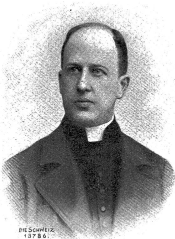
Monsignore Emanuel Corragioni d'Orelli, der derzeitige Kaplan der päpstlichen Schweizergarde.

Federbusch. Die Hosen sind kurz und gehen nur bis unter die Kniee. Die Waffe ist je nach der Verwendung der Mannschaft die Hellebarte oder das Gewehr neuerer Konstruktion; ein Seitengewehr hängt am gelben Ledergurt. Die päpstliche Fahne von Seide ist gelb und rot, in der Mitte das Geschlechtswappen des jeweiligen Papstes in Seide gestickt, mit weiß-gelber Kokarde. In unsern Bildern sehen wir das eine Mal Teile der Gardekompagnie zur Inspektion aufgestellt im Kasernenhof, rechts die Caserma; im kleinen Bild einige Gardisten innerhalb der Porta di Bronzo, in der Nähe der Wachtstube. Ein Gardist ist die Schildwache vor dem Gewehr, die andern sind Soldaten der Wachtmannschaft, die eben keinen Dienst haben, aber in Bereitschaft sein müssen und sich eben noch in der schweizerischen Muttersprache miteinander unterhielten. In der Mitte passieren hohe geistliche Personen, u. a. vielleicht ein Kardinal; die Schildwache vor dem Gewehr präsentiert, und die übrigen Soldaten haben sich von der Bank erhoben und nehmen Stellung an.