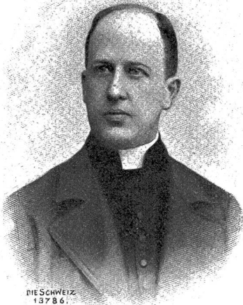
Monsignore Emanuel Corragioni d'Orelli, der derzeitige Kaplan der päpstlichen Schweizergarde.

Die Gardesoldaten haben viel freie Zeit, die teils für den Unterricht, den der Gardekaplan erteilt, verwendet, teils zu Ausgängen in die Stadt benützt wird. Sie sind für eine bestimmte Zeit angeworben, kehren aber meist bald wieder ins Vaterland zurück. Ihr Dienst ist während des größten Teils des Jahres ein leichter, mit wenig Mühsalen verbunden; doch