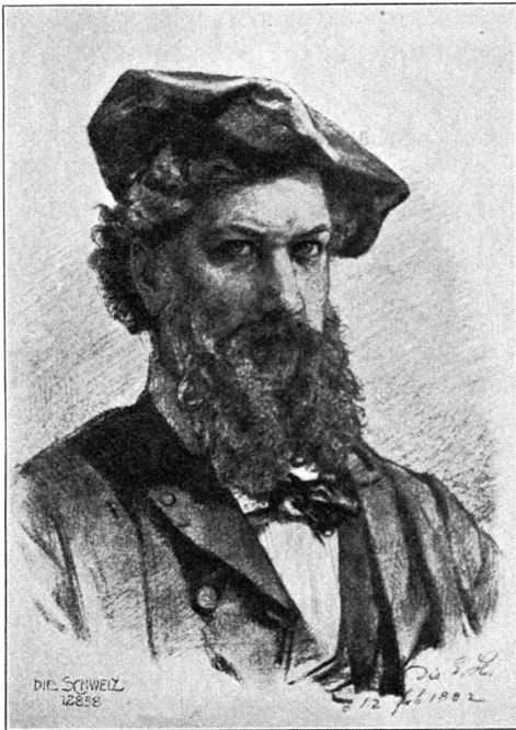
Ernst Stückelberg. Selbstporträt (1862).

ihr, als der andere schon durch die Hausthüre ins Freie trat.