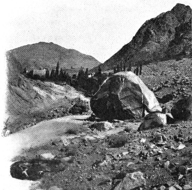
Das Kloster mit dem Klostergarten; im Hintergrunde der Djebel Munebja.

Schätze der Sinaibibliothek gewesen; durch sie wurde der weitere Ruin der Bibliothek aufgehalten, indem nun sowohl das gelehrte Abendland aufmerksamer nachforschte, als auch im Kloster selbst die Aufmerksamkeit erweckt wurde in Gestalt von Gewinnsucht, die in den alten Büchern wertvolle Kapitalien erblickte. In der That repräsentieren die vielen Manuskripte für das Kloster ein Depositum von wertvollen Obligationen, Aktien und Pfandscheinen, die eine occidentalische Bibliothek gerne bei hohem Kurs einzulösen würde. Einen wissenschaftlichen Wert besitzt die Bibliothek nicht für die Mönche, da sie keiner zu benutzen versteht. Der Bibliothekar, der jetzt gute Ordnung hält in der Bib-