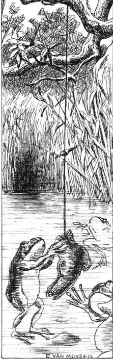
„Es hat einer angebissen“.