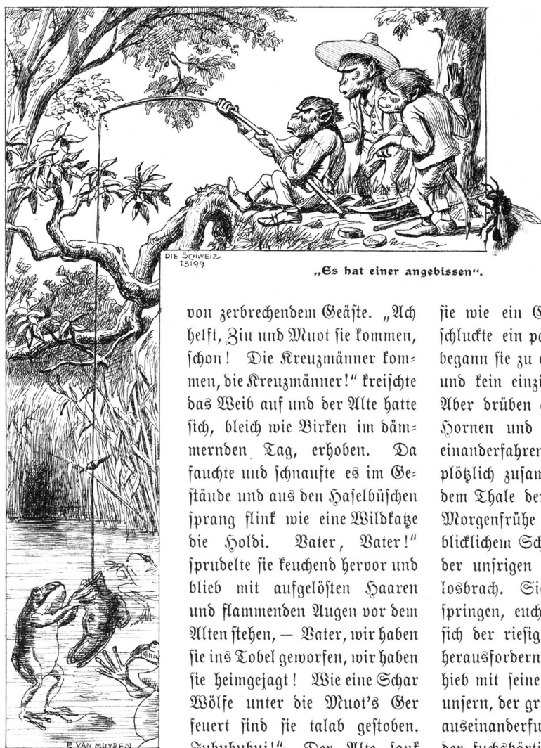
„Es hat einer angebissen.“

von zerbrechendem Geäste. „Ach helfst, Ziu und Muot sie kommen, schon! Die Kreuzmänner kommen, die Kreuzmänner!“ kreischte das Weib auf und der Alte hatte sich, bleich wie Birken im dämmernden Tag, erhoben. Da fauchte und schnaufte es im Geäst und aus den Haselbüschen sprang flink wie eine Wildkacke die Holbi. Vater, Vater!“ sprudelte sie keuchend hervor und blieb mit aufgelösten Haaren und flammenden Augen vor dem Alten stehen, — Vater, wir haben sie ins Tobel geworfen, wir haben sie heimgelacht! Wie eine Schar Wölfe unter die Muot's Ger feuert sind sie talab gestoben. Zuhuhuhui!“ Der Alte sank schwer aufatmend, auf's Milch-