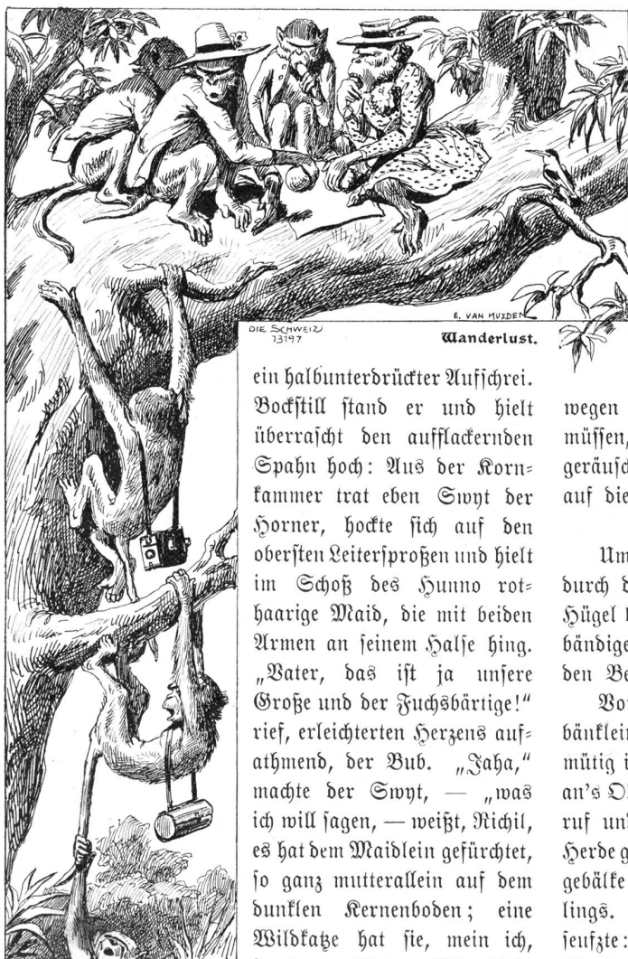
DIE SCHWEIZ 13197