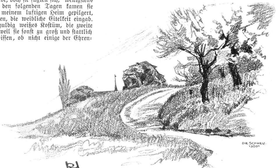
DIE SCHWEIZ. 13001

Inzwischen bauten schwielige Hände droben auf dem Festplatz die Riesenbühne (36 m auf 30 m), ohne jede Ueberstürzung, aber solid, als müßte das Festspiel am jüngsten Tage wiederholt werden, und im schönen Juni konnte darauf die erste allgemeine Spielprobe stattfinden. Welcher Jubel, als jeder einzelne Darsteller mit Nummer und Prädikat aufgerufen wurde: Kaiser Maximilian Nr. 1, Hofnarr Nr. 175, Landsknecht Spignagel Nr. 24, Stadtbüttel Nr. 113 zc. Und welche Ueberraschung, als bei der Aufstellung ein Patrizierfräulein sich plötzlich einer Grütliangergruppe zugeteilt sah. Frostig standen am ersten Abend die Gruppen beisammen, aber schon in der zweiten Probe begann am wärmenden Feuer der Poesie das Eis zu schmelzen und es vollzog sich mit der Zeit ein Akt idealer sozialer Ausgleichung und Annäherung. Bald hatten der Regisseur und sein Gehülfe Arbeit genug, des familiären Gepflauders Herr zu werden und das hinterste Pärchen zu zwingen, dem