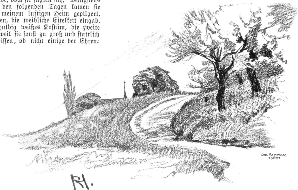
Weg zum Festplatz.

Inzwischen bauten schwellige Hände droben auf dem Festplatz die Niesenbühne (36 m auf 30 m), ohne jede Ueberstürzung, aber solid, als müßte das Festspiel am jüngsten Tage wiederholt werden, und im schönen Juni konnte darauf die erste allgemeine Spielprobe stattfinden. Welcher Jubel, als jeder einzelne Darsteller mit Nummer und Prädikat aufgerufen wurde: Kaiser Maximilian Nr. 1, Hofnarr Nr. 175, Landsknecht Spignagel Nr. 24, Stadtbüttel Nr. 113 zc. Und welche Ueberraschung, als bei der Aufstellung ein Patrizierfräulein sich plötzlich einer Grütliangergruppe zugeteilt sah. Frostig standen am ersten Abend die Gruppen beisammen, aber schon in der zweiten Probe begann am wärmenden Feuer der Poesie das Eis zu schmelzen und es vollzog sich mit der Zeit ein Akt idealer sozialer Ausgleichung und Annäherung. Bald hatten der Regisseur und sein Gehülfe Arbeit genug, des familiären Gepflauders Herr zu werden und das hinterste Pärchen zu zwingen, dem