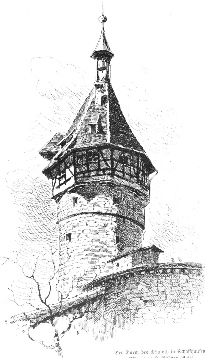
Der Turm des Munoth in Schaffhausen. Skizze von J. Billeter, Basel.

Der Pfarrherr fühlte ein mächtiges Mitleid; aber er war von ihrer Beichte nicht überrascht. Als er sie