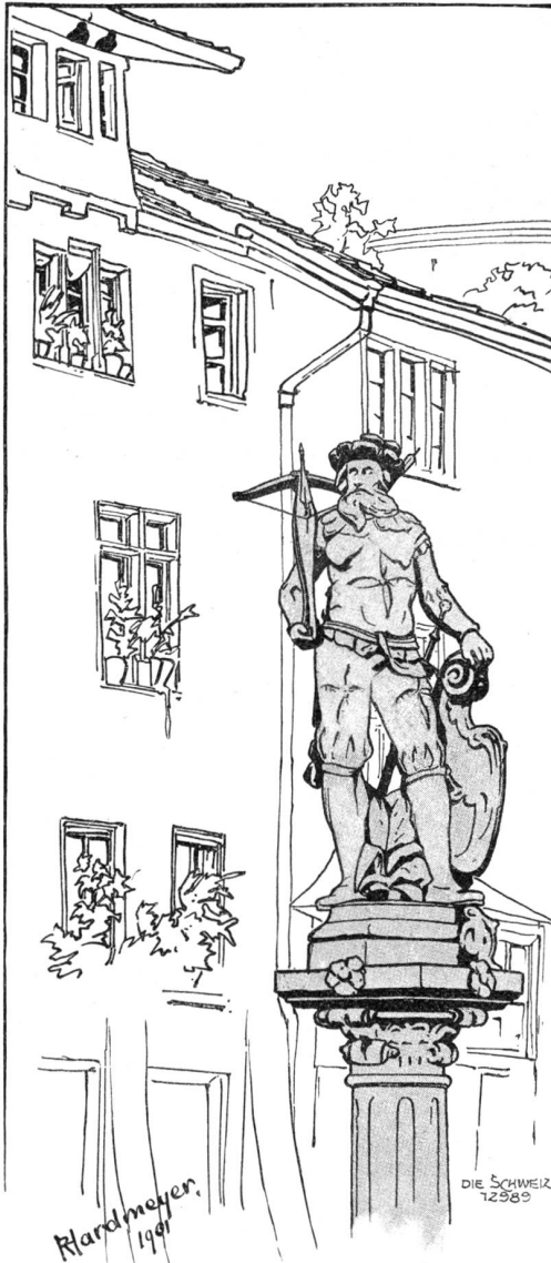
Der Tüllbrunnen in Schaffhausen. Originalzeichnung von H. Rindmeyer, Rüschach.