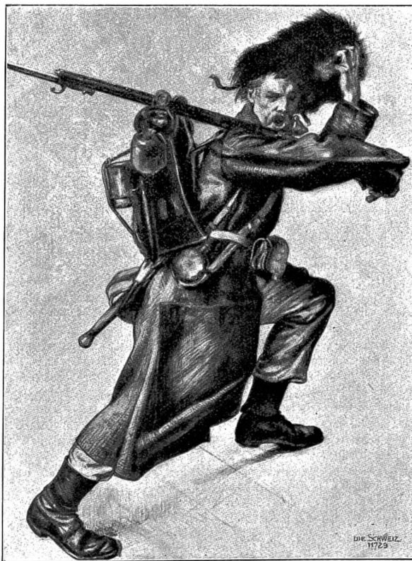
Edwin Ganz: Studie zu dem Gemälde „der Angriff von Montaignu“.

Das Bild zeigt eine Episode aus den belgischen Manövern des Jahres 1896; das Grenadierregiment erstürmt mit lautem Hurrageschrei „vive le roi“ die vom Feinde besetzten Höhen von Montaignu, unterstützt vom ersten Jägerregiment. Im Hintergrunde links, auf einer Anhöhe, wohnt Leopold II., der König der Belgier, dem imposanten Schauspieler bei, umgeben von seinem Generalstabe. Eine schwere, düstere Gewitterstimmung liegt über der Gegend und gibt dem ganzen Bilde