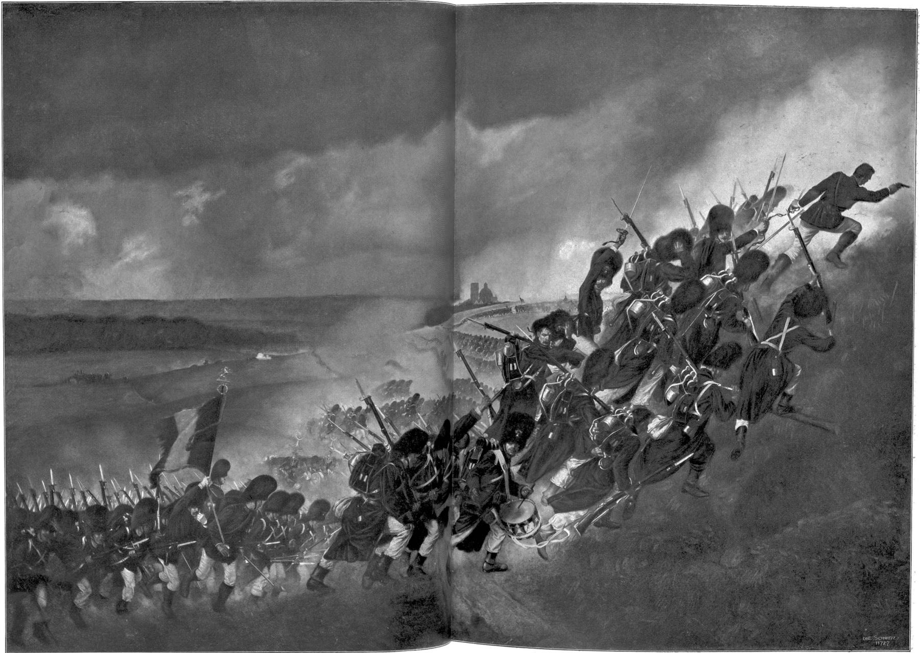
Sturm auf Montfaigu. Gemälde von Edwin Ganz, (Aitrich) Brüssel.