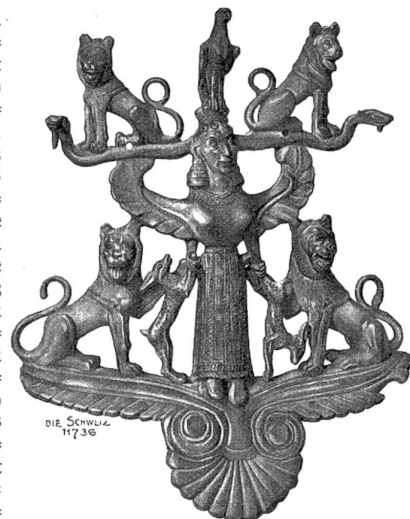
Fig. 10. Bronzebild am Hals des Grächwiler Bronzegefäßes.

Mann gewesen sein, denn man begrub seinen Streitwagen mit ihm, vielleicht auch sein Schlachtroß (Hufeisen) und gab ihm den größten Schatz ins Grab: die aus weiter Ferne stammende, goldglänzende Bronzevase mit dem Götterbilde. Es wäre auch möglich, daß jene unverbrannten Knochen Sklaven angehört hätten, die zu Ehren des Verstorbenen getötet und bei der Asche ihres Herrn begraben worden wären. Damit aber weder die frevelnden Hände feindlicher Menschen, noch die Tiere des Waldes die Ruhe des Toten stören könnten, umgab man das Grab mit einer Steindecke, einem Gewölbe gleich, und legte darüber den Mantel von Erde, in dem ein Jahrtausend später andere Geschlechter wieder Tote zur ewigen Ruhe betteten.