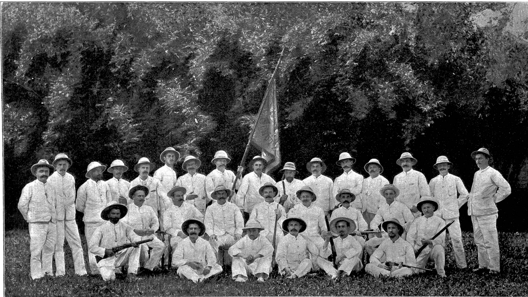
Der Schweizerverein „Helvetia“ in Deli (Sumatra).