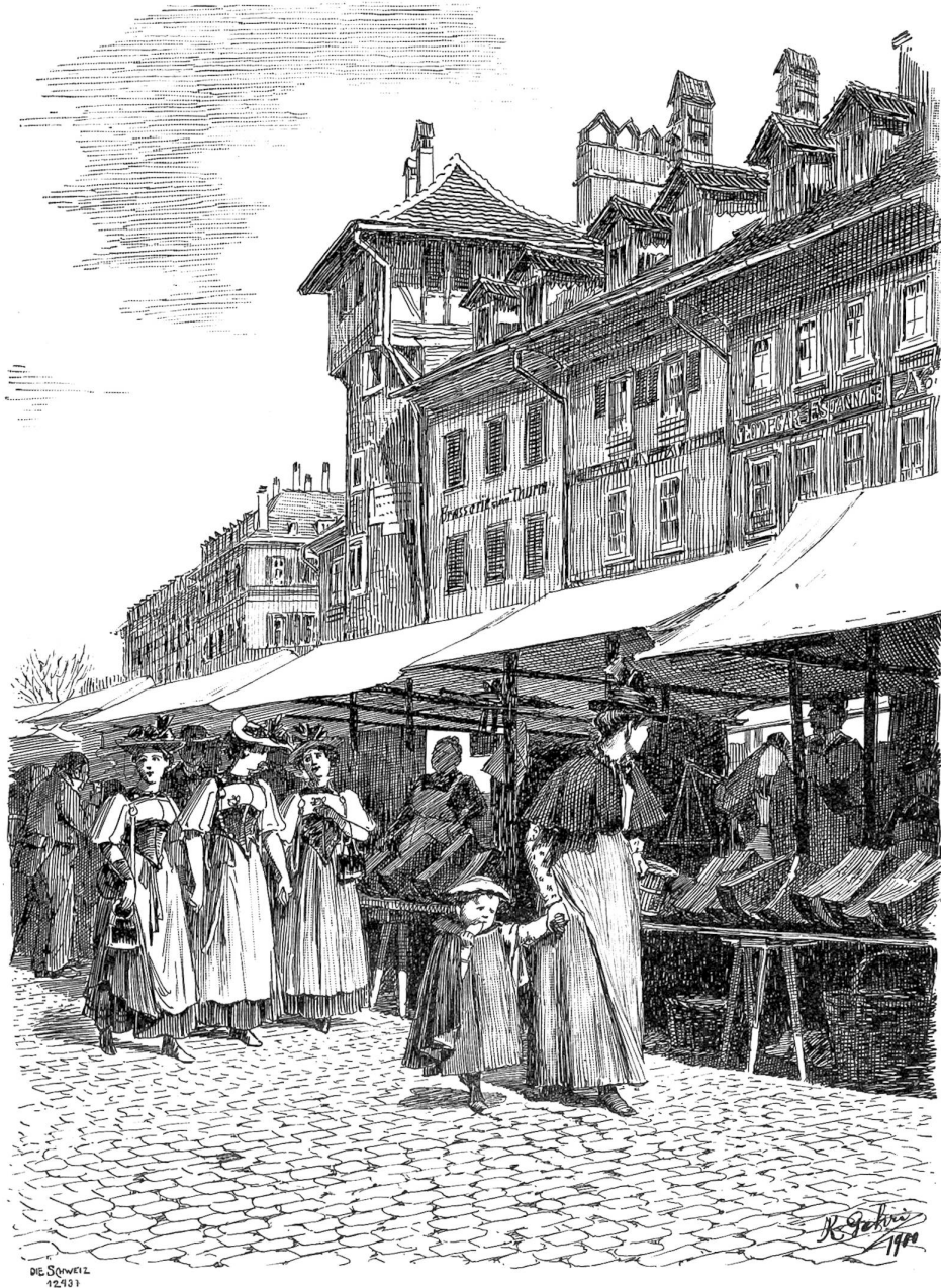
Der „Chäs-Märit“ in Bern. Originalzeichnung von Karl Gehri, Münchenbuchsee.

Indem die Herbstmesse Ende November stattfindet, kann es etwa vorkommen, daß meist alles im Schnee steckt. Aber seit die trocknen Winter bei uns Mode geworden und ein mildes Nachsömmerchen seine bleichen Strahlen oft selbst bis in den November hinein wirft, machen die fahrenden Künstler und Krämer dannzumal gute Geschäfte. Dafür wettert's und stürmt's und schneit's gewöhnlich während der Frühjahrsmesse um Ostern.