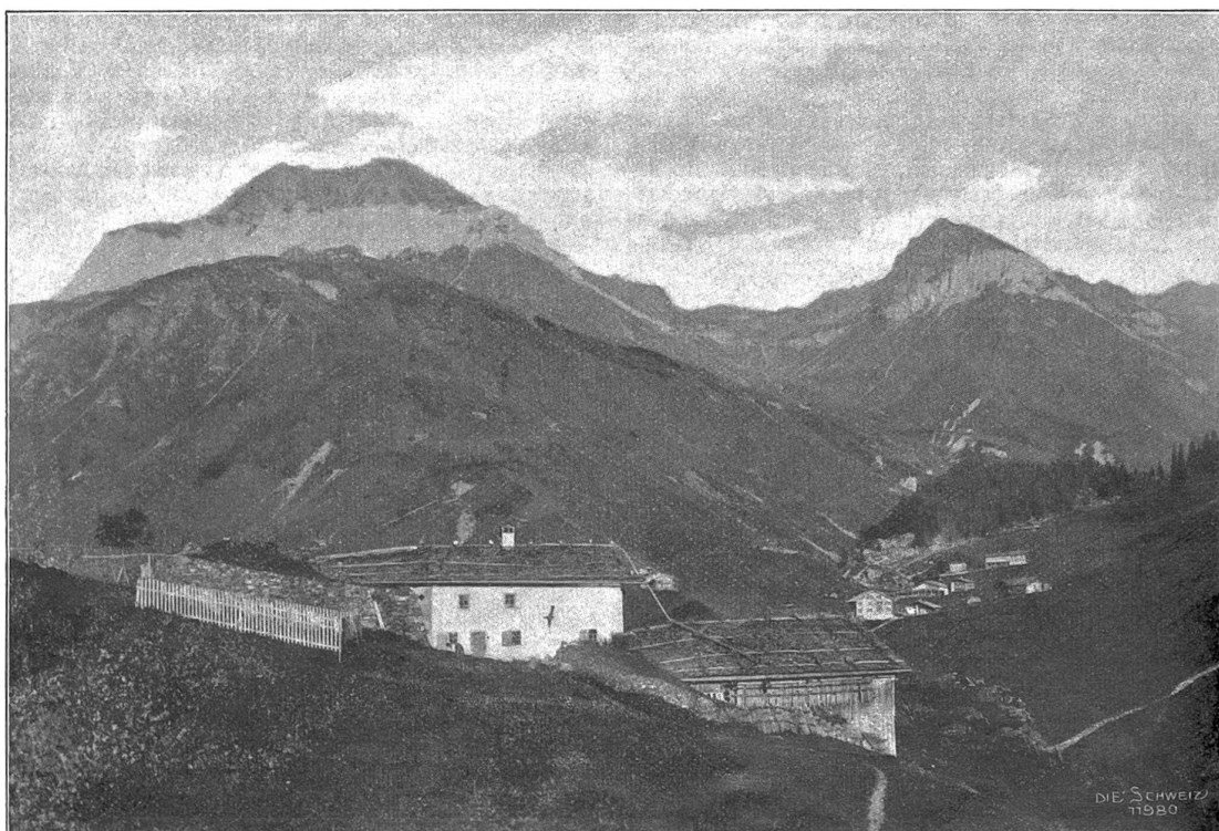
Haus und Scheune „zum Börd“ mit „Ebenhöck“ in St. Antönien (Graubünden). 1470 m ü. M. Im Hintergrunde der Schöllberg, 2574 m. Rechts die Gempfluh.