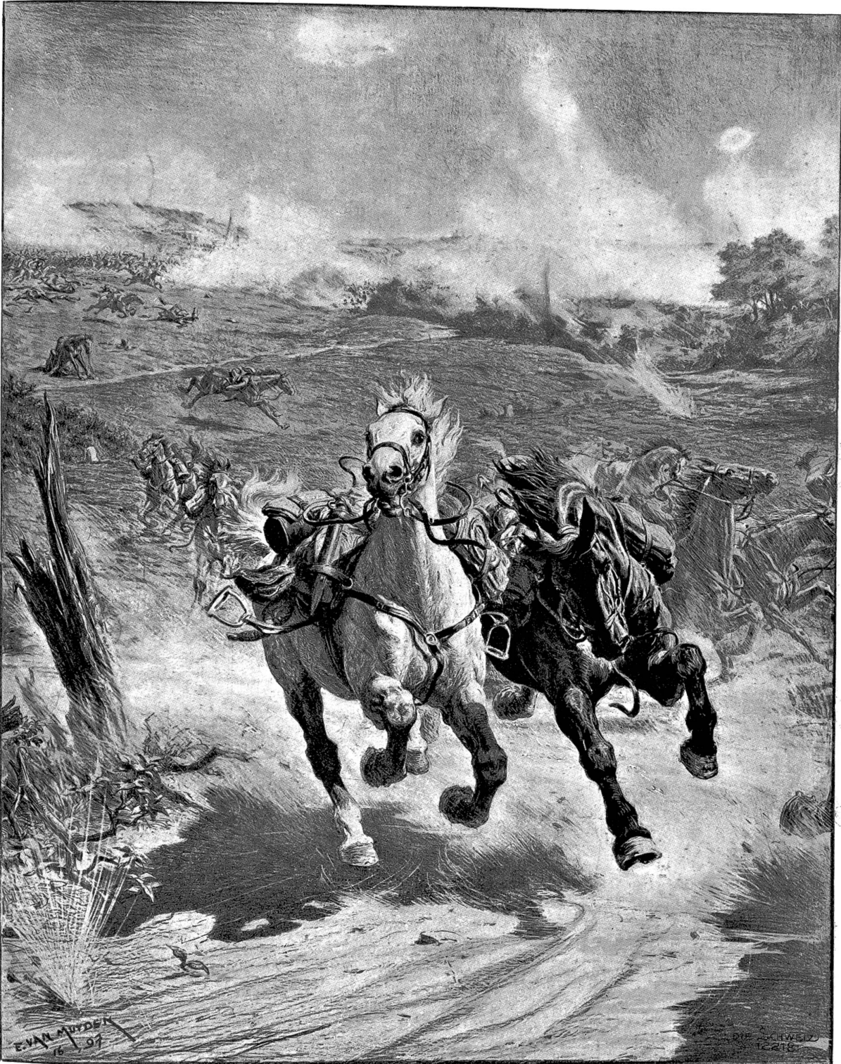
Herrenlose Pferde auf dem Schlachtfelde. Nach einer Lithographie von E. van Muden, (Genf) Paris.