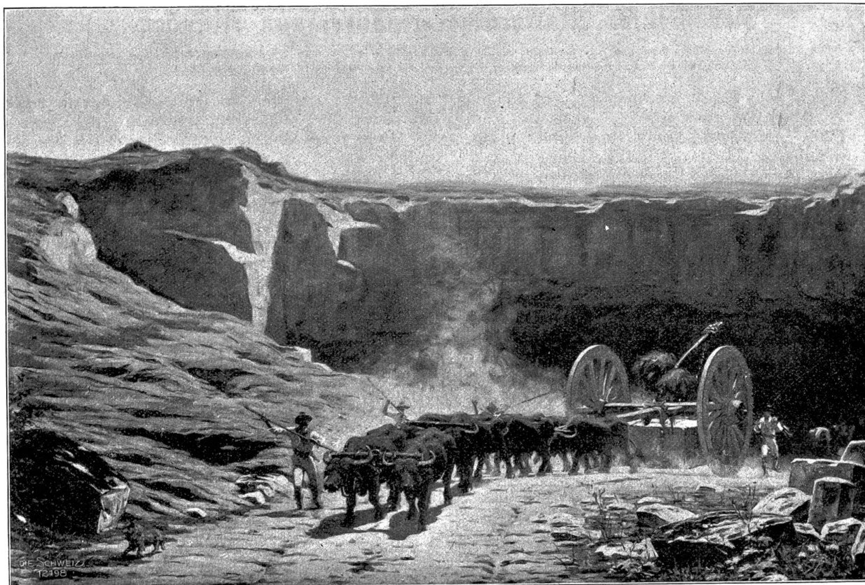
Steinbruch in der römischen Campagna. Gemälde von Evert van Nuyden (Genf) Paris.

des Berliner Zoologischen Gartens hatte er eine große Vorliebe für das Tierstudium gefaßt, eine Neigung, die ihn, ohne ihn allerdings von andern Sujets völlig abzuziehen, doch fast ausschließlich beherrschte.