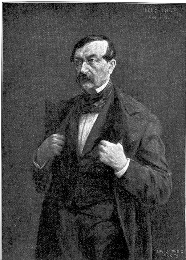
James Fazy. Gemälde von Baud-Bovy (1879). Im Besitze der öffentlichen Bibliothek in Genf.