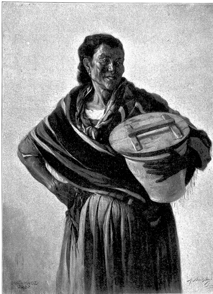
Alte Zigeunerin (Oliven-Verkäuferin). Gemälde von E. Baudouin (Sevilla 1881). Im Besitze der Familie.

„Hinein in das schöne, von Kunst und Liebe durchleuchtete Leben!“