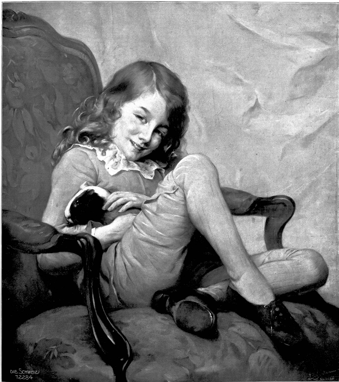
Die Untertrennlichen. Gemälde von Baud-Bovy (1885). Im Besitze des Herrn Léo Bovy, Genf.