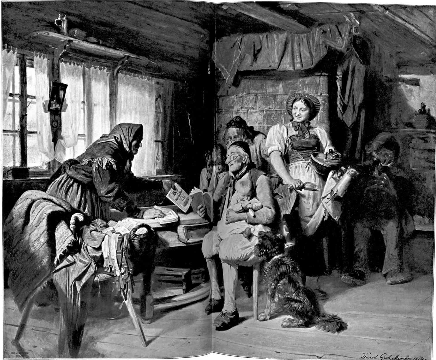
Der neue Kalender. Gemälde von Konrad Grob, München.