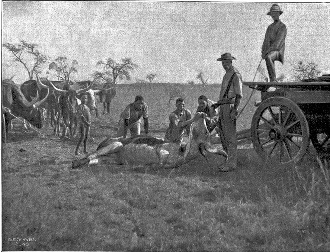
Rinderpest in Transvaal. Ausgespannter Ochsenwagen mit einem kranken Tier.