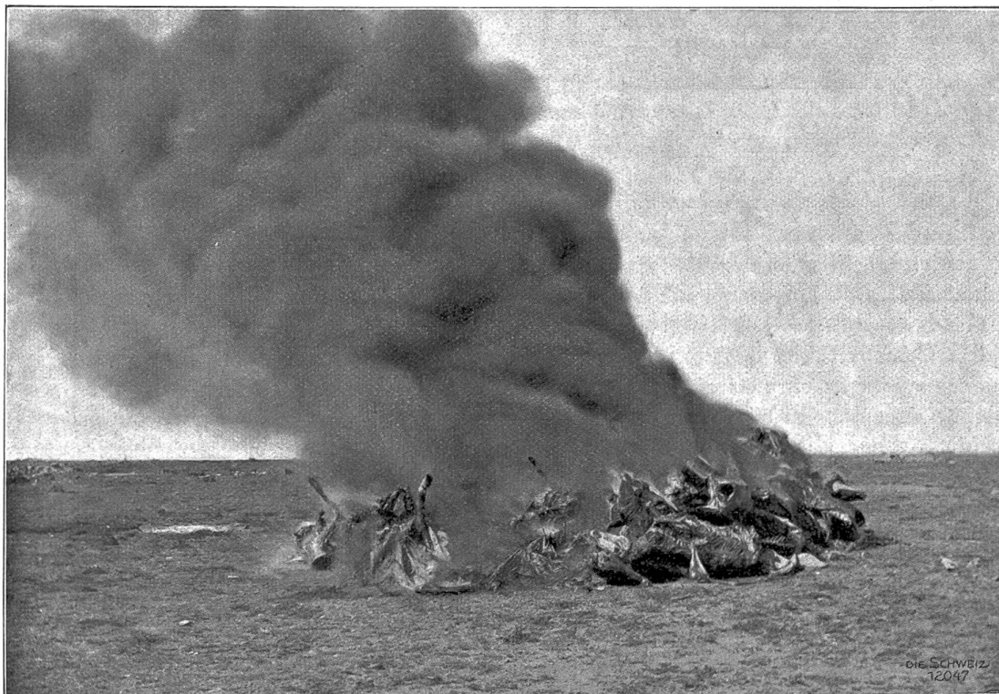
Rinderpest in Transvaal. Verbrennen der Tierleichen.