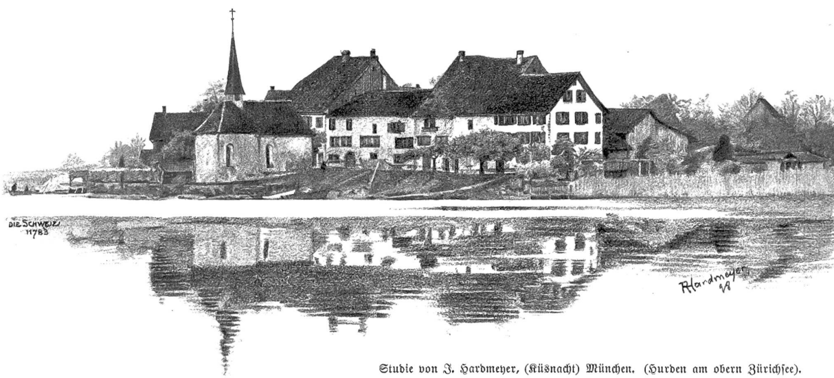
Studie von J. Handmeyer, (Küsnacht) München. (Gurben am oberen Zürichsee).