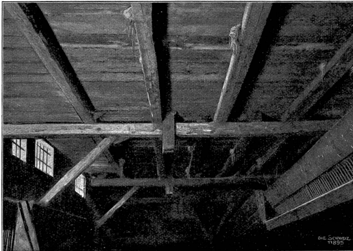
Schaffschuppen des Hrn. König. Mit Schwalbennestern.

Am gleichen Ort gemachte Beobachtungen an zwei andern Vogelspezies erhärten die oben aufgestellte Behauptung. Dieses Frühjahr sah ich auf der Allmend viele Staren weiden. Nun muß sich aber Jeder sagen, daß es wohl für deren Nährtiere, Regenwürmer, Schnecken und dergleichen keinen ungünstigeren Boden gibt, als den harten, festgestampften Kiesboden der Allmend. Wieder waren es die Schafe, die ihnen hier ein wie es scheint sehr ergibiges Ernährungsfeld aufschloffen. Bei genauerer Untersuchung enthielt jeder