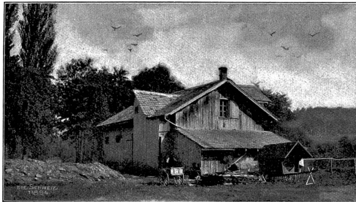
Schaffshuppen des Hrn. König an der Leimbacher Brücke (Zürich).

ganzen Stall zerstreut. Die Anlage ist bei den meisten die gewohnte seitlich an den Balken; merkwürdig ist's und zugleich ein Fingerzeig für die große Intelligenz der Vögel, daß alle ausnahmslos immer in der Mitte eines Brettes stehen und jede Fuge so sorgfältig vermieden ist, damit ja der durchfallende Staub das saubere Nestchen nicht verunreinige. Aus dem Standort einzelner Nester läßt sich leicht erkennen, wie gern die Schwalbe diese stützt, um sie so vor dem Fallen besser zu bewahren. An einem Querbalken, über den sich die im hintern