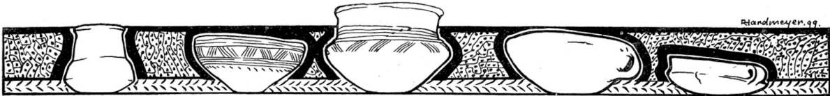
Tongefässe aus der Bronzezeit.

weiche Bettchen von den beschmutzten Extremitäten und trägt sie im Schnabel ins Freie hinaus. Anderswo sind ältere Bruten. Im weichen Dunenkleid hocken die fünf Sprößlinge in der Mulde, recken ihrer Ernährerin die Köpfe hoch entgegen, so daß man die gelben Schnäbel und den orange gefärbten Gaumen über das Nest ragen sieht. In den meisten Nestern aber sitzen die halberwachsenen Jungen, an deren Leib die ersten Federn sprießen, wie im Kranz auf dem obern Rand. Für die fütternden Eltern ist nirgends Raum; am Neste krallen sie sich fest, drücken den langen Gabelschwanz fest als Stütze gegen dessen Wand und befriedigen in dieser Zwangsstellung die kleinen Hungerschlucker. Ueberall, wohin das Auge blickt, dasselbe Bild aufopfernder Elternpflicht und liebevoller Kinderpflege. Ein Meer von Liebe weicht den profanen Raum zum Tempel edler Selbstverleugnung und opfermutiger Hingabe von Wesen, denen der stolze Menschenwahn jede heilige Tätigkeit absprechen will. Ein kleines Schwalbenheer wird jedes Jahr unter diesem Dach geboren. Rechnen wir durchschnittlich nur 4 Stück auf ein Gelege, so macht das bei zweimaliger Brut 144 junge Schwalbchen; mit den 36 Alten steigert sich die Zahl auf 180 Stück. Fällt auch eine Anzahl Krankheiten oder dem Raubgewild zum Opfer; denn, wie ich selbst mich überzeuge, haben Baum- und Wanderfalk diese Gegend zu ihrem Jagdgebiet erkoren, so thut dieser Schuppen mehr zur Forterhaltung dieser lieblichen und nützlichen Vögel, als das größte Bauerndorf.