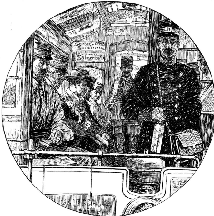
Auf dem Weg nach Oberstrah und Bluntern. (Zentrale Zürichbergbahn).

Täglich sind 60 bis 90,000 Briefe und Druckfachen an ihre Adressen zu befördern. Welch eine Arbeit haben damit unsere Postbeamten zu bewältigen, und da sind wir noch ungehalten, wenn sich dann und wann ein Brieflein oder ein Zeitungsblatt verschiebt und einige Stunden verspätet in unsere Hände kommt.