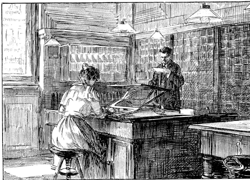
Amerikanischer Briefschalter. (Innen-Ansicht).

kehrs aus aller Herren Ländern, der sich hier staut, haben sich ganze Ballen von Zeitungen aufgehäuft, die wohlfeile Wochenlektüre des Volkes. Die ganze Nacht durch blieben die weiten, hohen Säle des neuen Postgebäudes erhellte; denn bis zur frühen Morgenstunde hatten Beamte den Nachtdienst und sortierten geschäftig den Inhalt der Säcke.