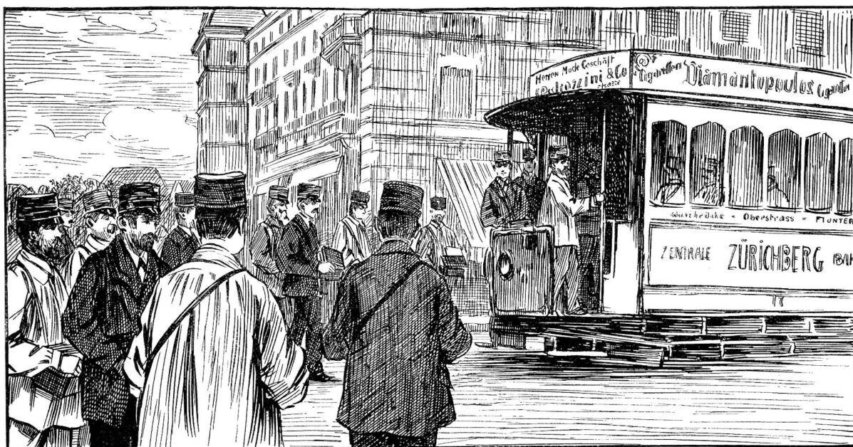
Beförderung der Briefträger durch die elektrische Straßenbahn. (Beim Hotel Bellevue).

Büreau hat seinen Auspacktisch, welcher mit seiner umrandeten Platte dem Bett einer Weinpresse ähnelt und auf den die Säcke entleert werden. Von hier kommen die Briefschaften auf den Stempeltisch, und auf dem Sortiertisch endlich wird das berghoch sich aufschichtende Material mit Sorgfalt sortiert. Im Transitbüro der Briefexpedition geschieht dies nach Routen. Für jede von Zürich abzweigende Postroute steht hier ein Gestell mit einer größeren oder kleineren Zahl von Fächern, jedes den Namen einer der Hauptstationen jener Route tragend. Mit geschärfter Ortskenntnis und großer Gelenkigkeit befördern die Beamten jedes Transitstück in das richtige Fach, und was sich durch die Distribution überall angesammelt hat, wird rasch zusammengebunden und in die bereithangenden Säcke wieder verpackt, damit der nächste Postzug es seinem Bestimmungsort zuführe.