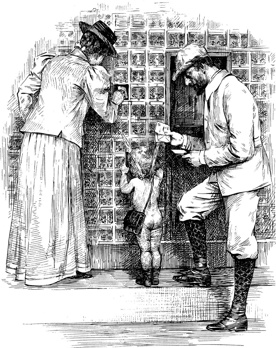
Der amerikanische Briefschalter im neuen Postgebäude in Zürich.

Originalzeichnung von Hans Meyer-Cassel.