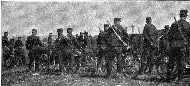
Radfahrer zum Ordonnanzdienst.