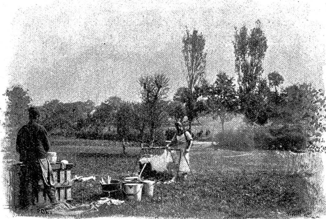
Abendsuppe mit „Spak“.

Es wurde ihr einwenig schwach, sie mußte sich anlehnen.