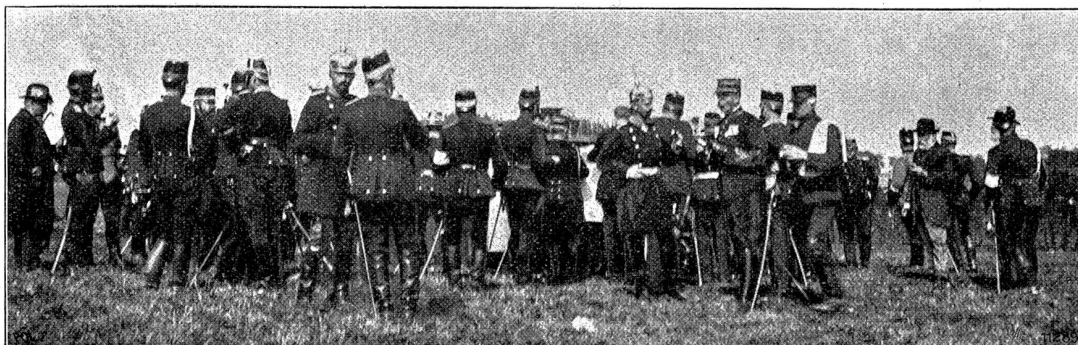
Nach der Kritik.