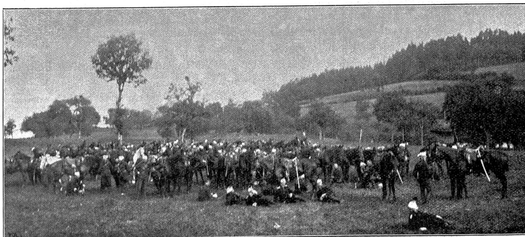
Schwadron während der Rast.