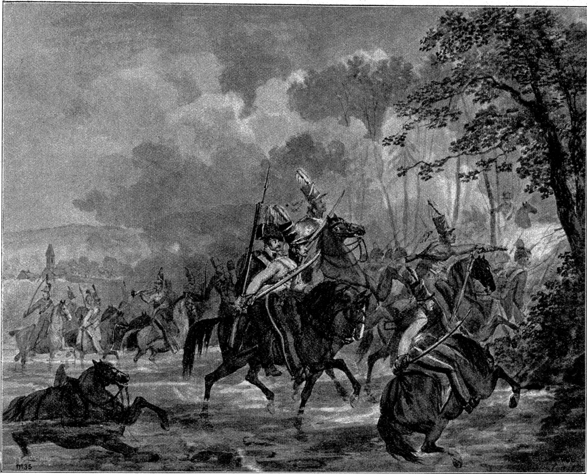
Uebergang der Franzosen über die Limmat bei Dietikon.