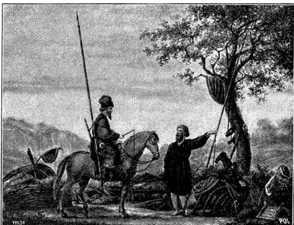
Lager Uralischer Kosaken in der Schweiz.

Original im Besitze der Kunstgesellschaft Zürich.