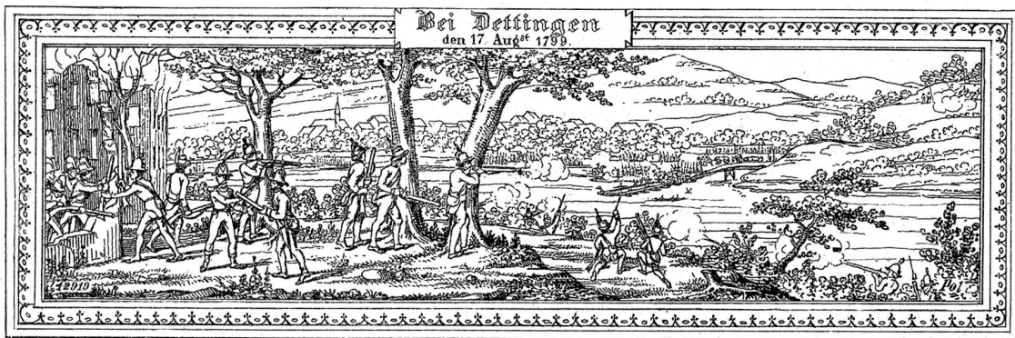
Gefecht bei Döttingen. Nach einer Lithographie, im Besitze der Stadtbibliothek Zürich.