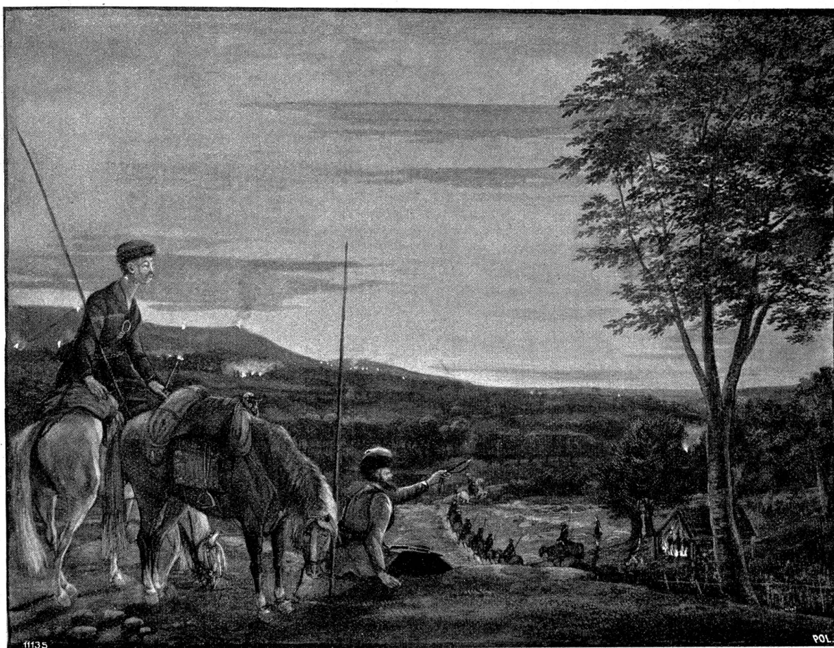
Russische Kosaken überschreiten die Sihl.

Nach einer Gouache-Zeichnung von Salomon Landolt. Im Besitze der Kunstgesellschaft Zürich.