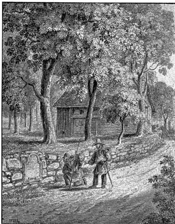
Gedenkstein, errichtet an der Stelle in der Nähe von Schänis, wo General Hoke fiel. Nach einer im Besitze der Kunstgesellschaft Zürich befindlichen Originalzeichnung von Franz Hegi.

Mit welchen Gefühlen man diese Russen in Zürich erwartete, zeigt ein Brief der wackeren Urgroßmutter an ihren Sohn, dat. d. 31. August, in welchem sie schreibt: „Eine wichtige Veränderung „ware diese Woche bei uns vorgefallen, welche viel Bangigkeit „und Furcht erweckte: Letzten Samstag rückten die russischen „Truppen in unsere Stadt ein, welche vorher alle Tag näher „gegen der Stadt kamen. Du kannst dir vorstellen, wie mir „zu Mut ward, als der Befehl kam, daß das bei uns stehende „Bataillon abends 6 Uhr fortmüße und in unsere Gemeind „russische Truppen kommen werden. Es war mir Angst und „bang, da ich schon wußte, daß sie alles, was eßbar ist, weg- „nehmen und uns schon von den kaiserlichen vieles genommen „und verderbt worden, was du dich verwundern würdest, wenn „du die Wies bis hinten an den Wagenischopf sehen würdest.