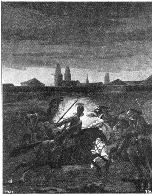
Reiterkampf im Riesbach.

Nach einer Gouache-Zeichnung von Salomon Landolt. (Original im Besitz der Kunstgesellschaft Zürich).