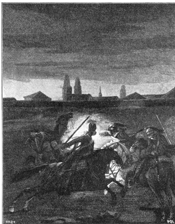
Reiterkampf im Riesbach.

In der neuen Stellung verblieben nun beide Heere während drei und einhalb Monaten einander gegenüber. Die Lage der Bewohner der Stadt Zürich war keine behagliche: Die Oesterreicher stellten zwar weniger hohe Anforderungen als die französischen Truppen an die Bürger; gleichwohl wurde die Stadt ausgefogen, und ein weiterer furchtbarer Zusammenstoß der beiden Heere war zu befürchten. Es fanden hie und da kleinere Gefechte ohne wesentliche Bedeutung statt, so am 8. und 15. Juni und am 14. August. Am erstgenannten Tage bei Albisrieden und Utikon, am zweitgenannten Tage bei Wiedikon und am 14. August auf der ganzen Linie. An diesem Tag nämlich unternahm Massena einen Schein-