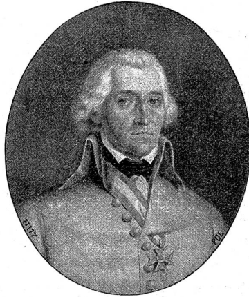
General J. C. von Höge.

Noch ehe die Infanterie eintraf, ritt Höge ein wenig „rechts von der Straße ab, um besser in das Dorf hineinzufahren; da traf ihn eine Flintenkugel in den linken Oberarm. Dem Verwundeten entfuhr die halbblaute Aeußerung: „Jesus