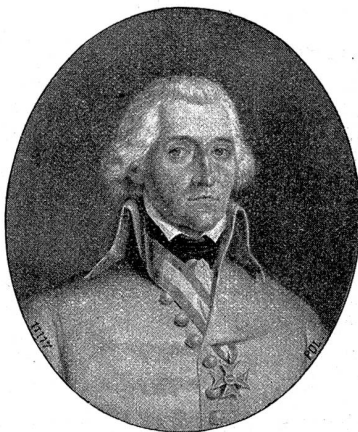
General J. C. von Hoge.