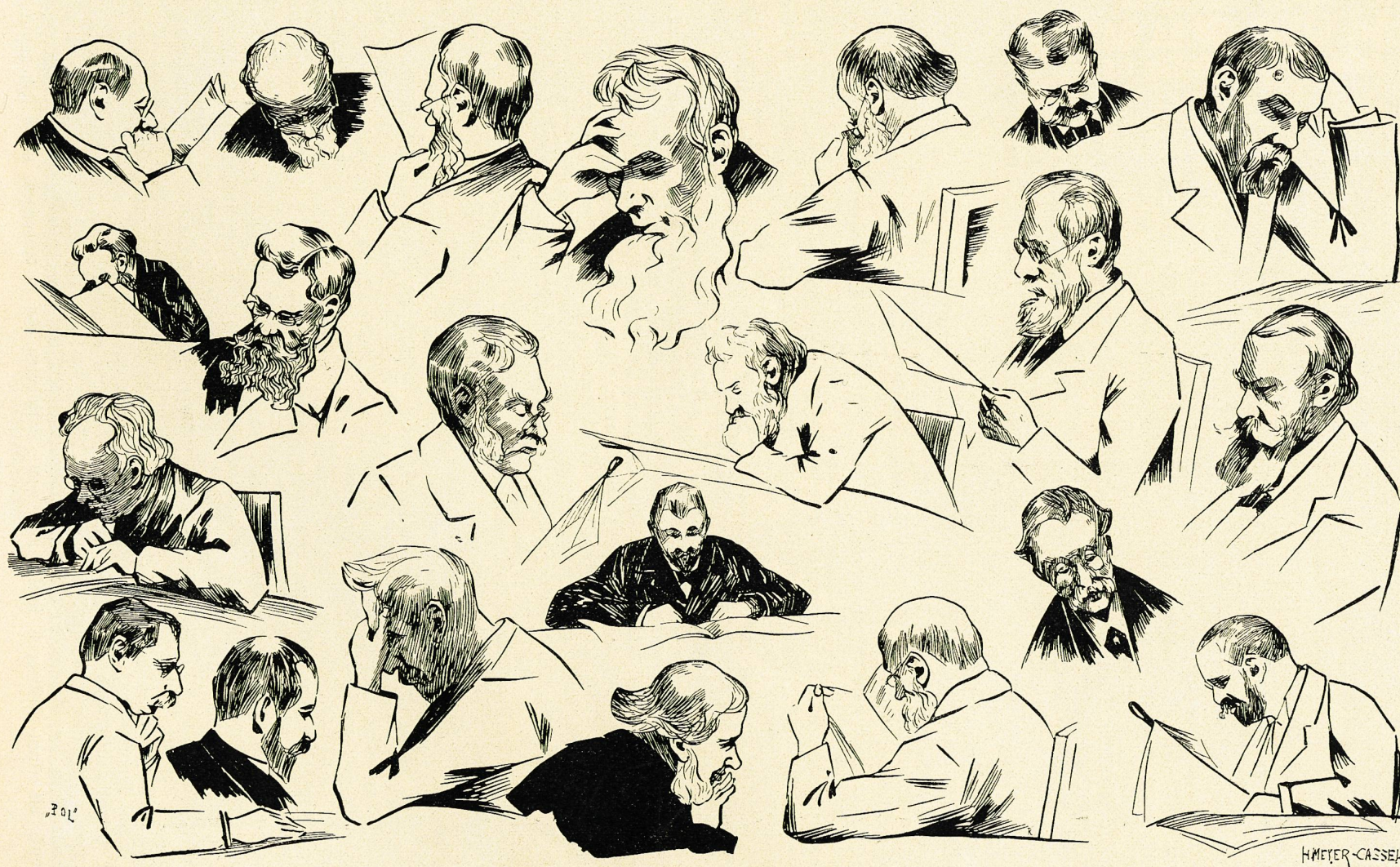
Studien aus dem Lesesaal. Von H. Meyer-Cassel.