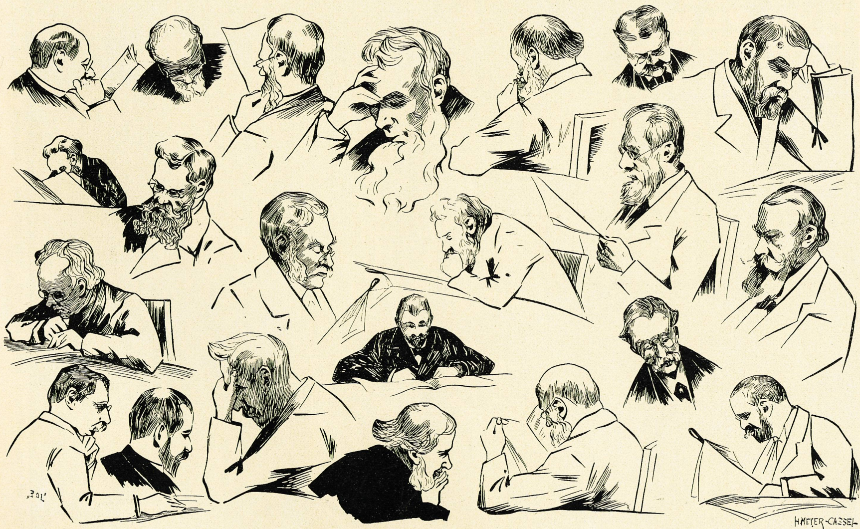
Studien aus dem Lesesaal. Von H. Meyer-Cassel.