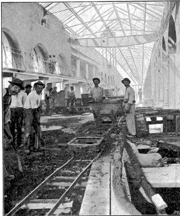
Innenansicht des Elektrizitätswerkes nach dem Brande.