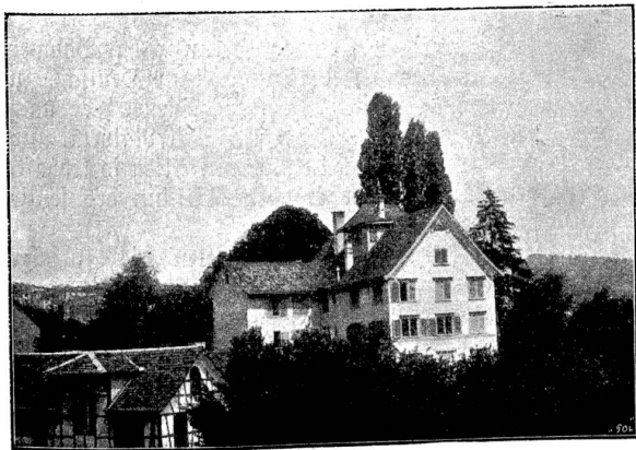
Das Haus „zum Berg“ in Zürich (Bodmers Wohnhaus).

Gerne erinnert sich die Vaterstadt Gottfried Kellers und C. F. Meyers daran, daß sie schon vor anderthalb Jahrhunderten einmal in der deutschen Literatur etwas, und zwar ziemlich viel, zu sagen hatte, wie in der nachklassischen, so einst in der vorklassischen Epoche. Feierten wir doch am 19. Juli, demselben Tag, der uns unsern Meister Gottfried geschenkt, auch den zweihundertsten Geburtstag des Mannes, der die Geistesblüte der Vindicta-Stadt hat wecken helfen.